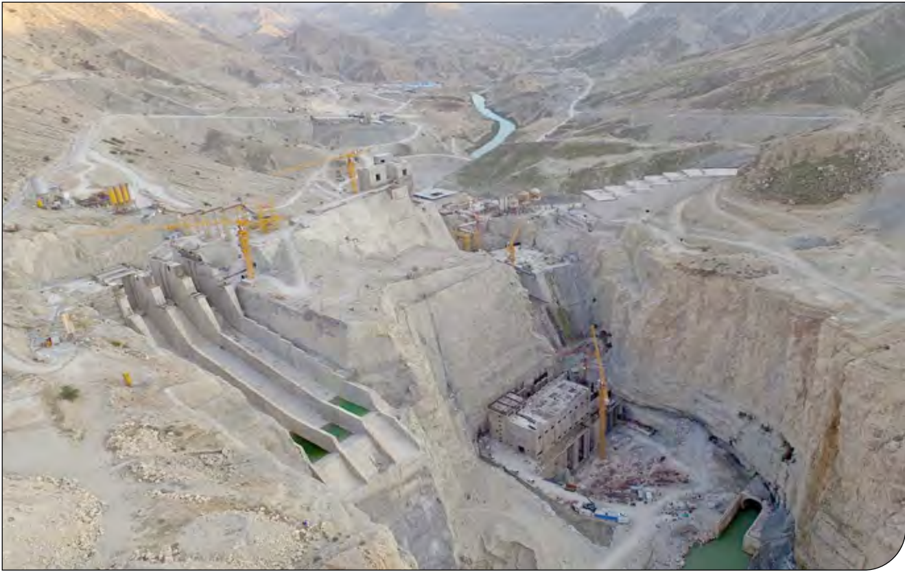
یک عده‌ای بیمار، یک عده‌ای معاند نظام و عده دیگر حقوق‌بگیر برای تخریب نظام و کارهای بزرگ صورت گرفته در آن هستند.

اهانت‌ها و حرف‌های بی‌پایه و ناشایست به دلسوزان این مرز و بوم ما را از پرسشگری باز نمی‌دارد محدوده سد چم‌شیر، گسل‌ها و زلزله‌های بسیاری را در ۲۰ سال گذشته تجربه کرده است