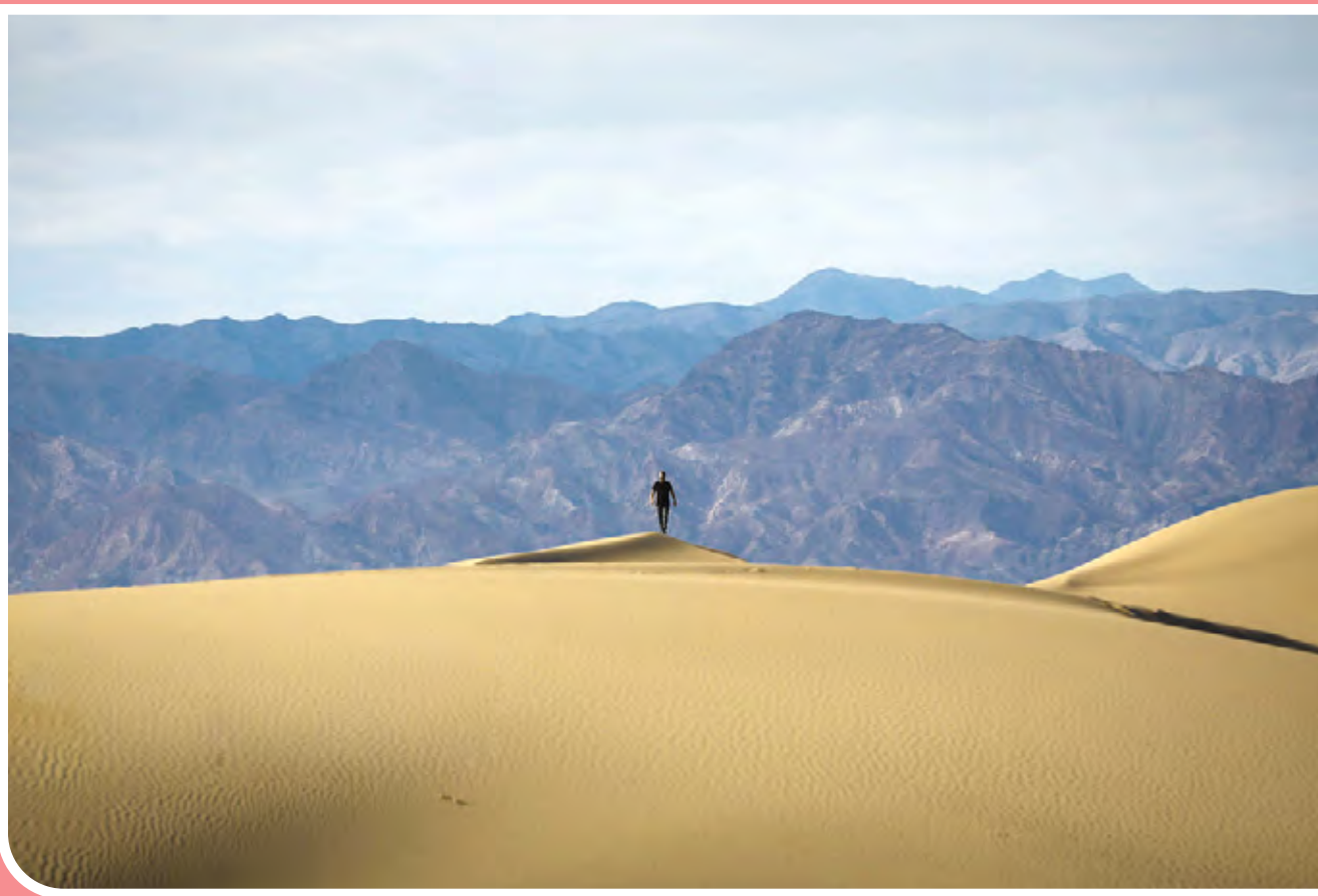
کویر ریگ زرین / استان یزد با طبیعت کویری، ناشناخته‌ها و جاذبه‌های زیادی در دل خود دارد که یکی از این جاذبه‌ها کویر «ریگ زرین» است. کویر ریگ زرین به نام کویر «مغستان» نیز شناخته می‌شود. ویژگی بارز این کویر که در نزدیکی شهر اردکان و در محدوده استان یزد قرار گرفته، رمل‌های قوسی شکل است که در زمان طلوع آفتاب، تابش نور خورشید، این کویر را طلایی می‌کند.