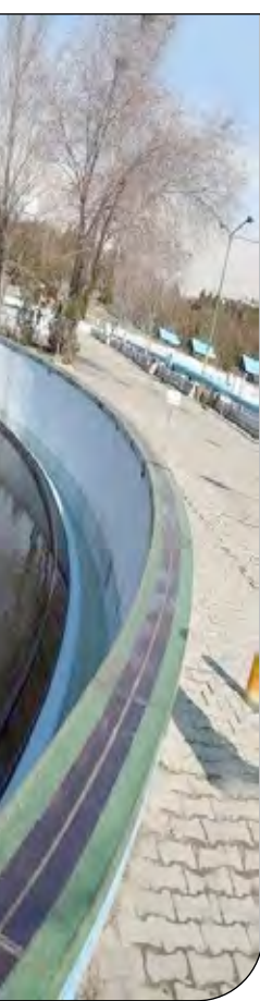
سیستم آب در تهران

نایب رییس کمیسیون انرژی اتاق بازرگانی بیان داشت، وظیفه وزارت نیرو تعیین نرخ‌های خرید تضمینی برق تجدیدپذیر به اندازه مناسب و ابلاغ آنها در ابتدای هر سال است، نه تعیین قیمت نیروگاه. تعیین قیمت نیروگاه وظیفه ادارات استانی کمیته امداد و بسیج سازندگی در هر استان است که از طریق استعمال قیمت و برگزاری مناقصه انجام می دهند.