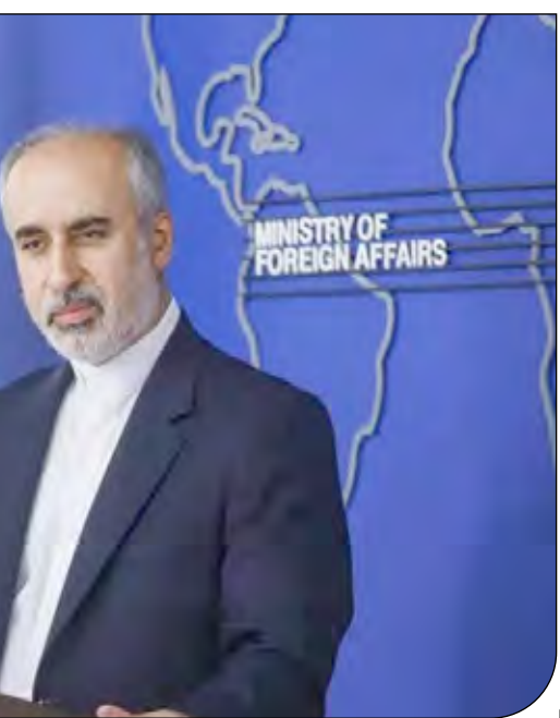
— وزیر امور خارجه —

رهبر انقلاب از نمایشگاه تولیدات فرهنگی هنری پیرامون شهید سلیمانی بازدید کردند. به گزارش پایگاه اطلاع‌رسانی دفتر مقام معظم رهبری، آیت‌الله خامنه‌ای در حاشیه دیدار خانواده شهید سلیمانی، از نمایشگاه تولیدات فرهنگی هنری پیرامون شهید سلیمانی بازدید کردند.