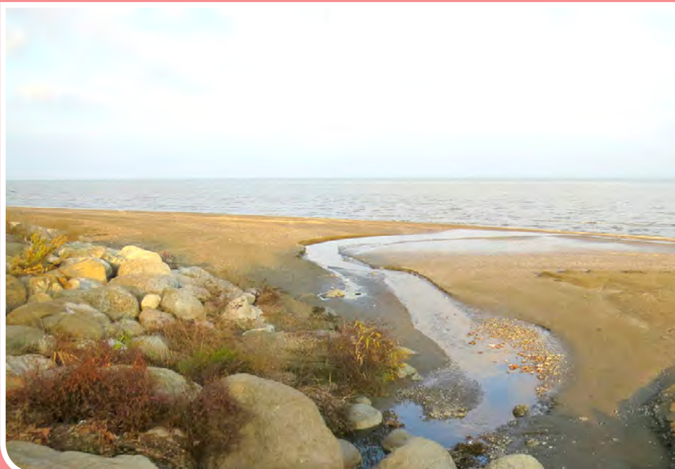
ورود فاضلاب‌های شهری آستارا به دریای خزر - روزانه حجم بسیار زیادی از فاضلاب‌های خانگی آستارا از طریق لوله‌های متصل به رودخانه‌ها به صورت مستقیم وارد دریای خزر می‌شود.