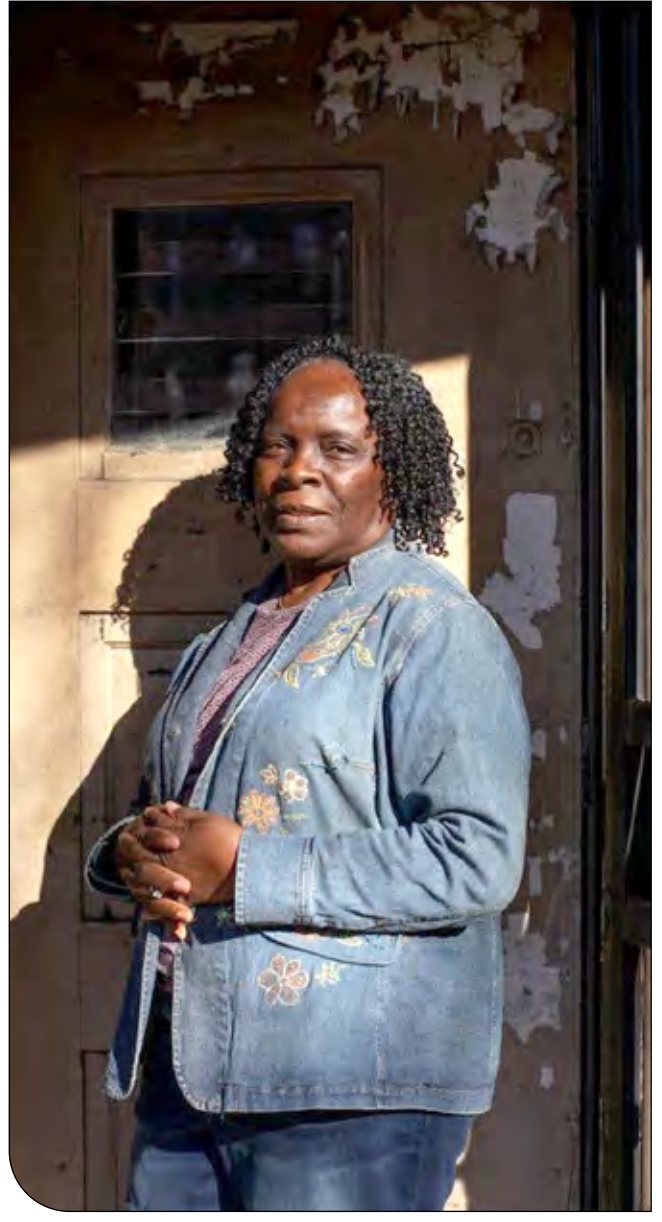
عکس: خانم گرگوری، منبع نیویورک تایمز |