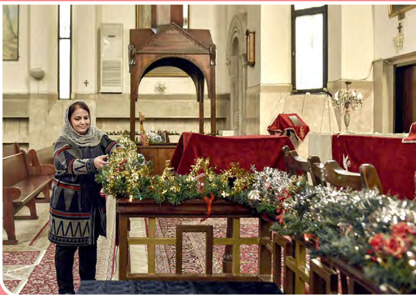
تمیز کردن کلیسای گریگور روشنگر مقدس برای سال نو میلادی