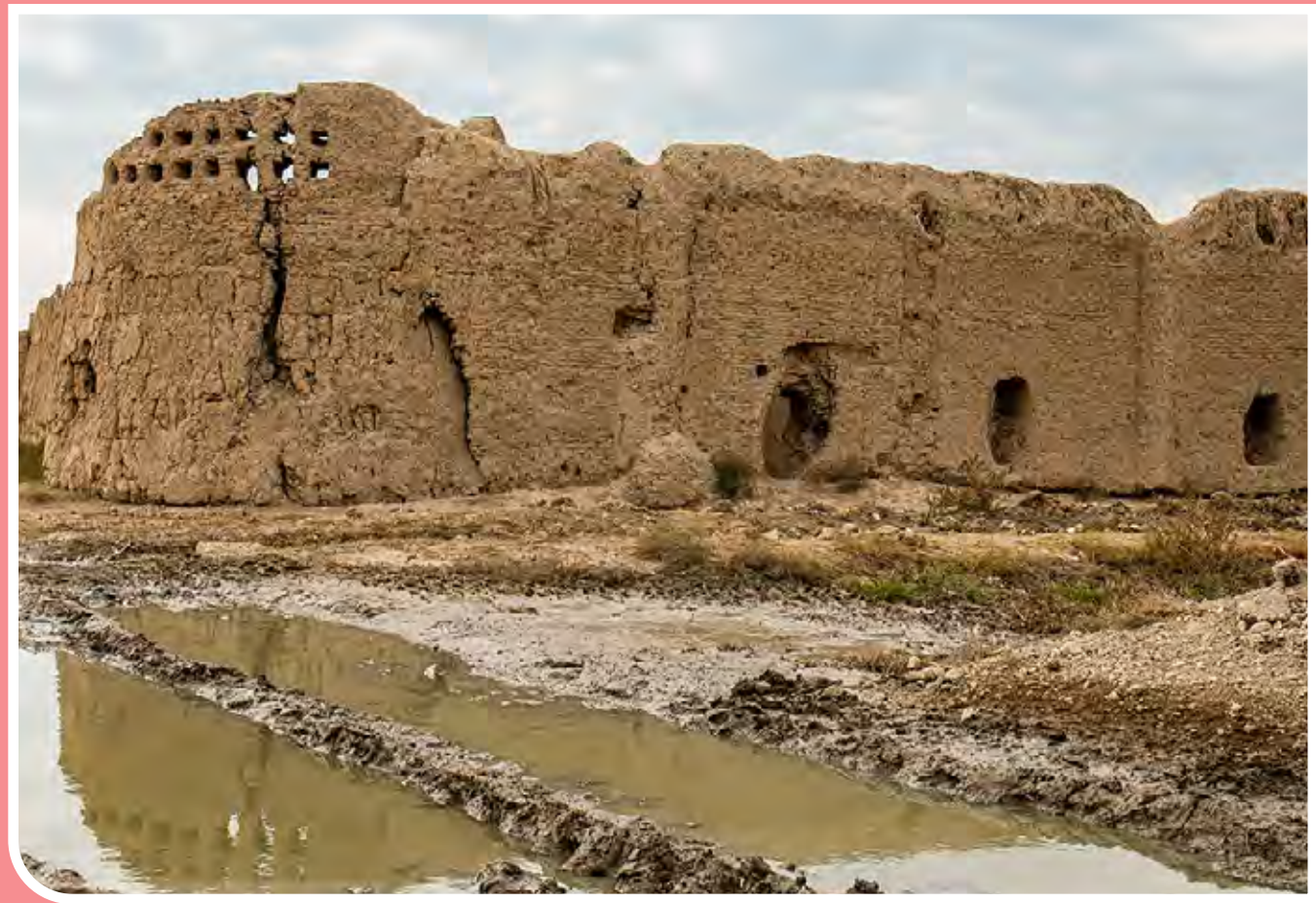
قلعه خماریآباد - قلعه خماریآباد در جنوب استان تهران، در مجاورت روستای جعفرآباد جنگل واقع شده است و قدمت آن به دوره قاجار باز می‌گردد آنچه از این آثار به جا مانده وضعیت خوبی نداشته و در صورت عدم توجه مسئولان در سال‌های آتی به طور کامل نابود می‌گردد.