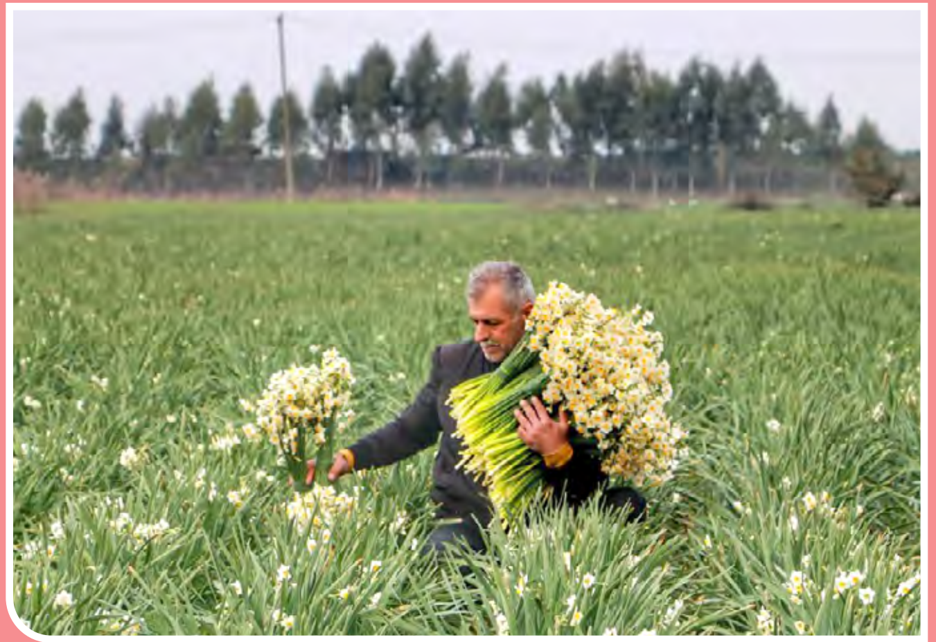
شمیم عطر نرگس در کردکلا - برداشت گل نرگس در نرگس‌زارهای روستای کردکلا جویبار همزمان با فصل زمستان آغاز شد.