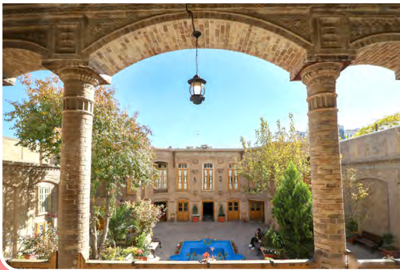
خانه تاریخی داروغه مشهد/ خانه تاریخی آخرین داروغه مشهد در زمینی به مساحت ۶۱۰ متر مربع در اواخر دوره قاجار به دستور یوسف خان هراتی اولین رئیس نظمیته پس از مشروطه به‌منظور اقامت شخصی و پذیرایی‌های رسمی ساخته شد. این اثر را می‌توان بازمانده‌ای از آخرین مرحله معماری سنتی ایران دانست که در عین حال تأثیر هنر روس نیز در آن مشهود است.