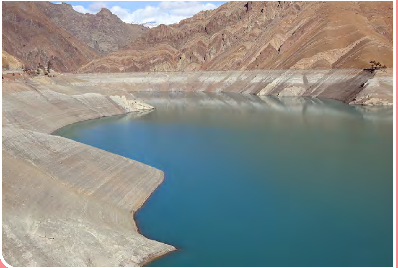
وضعیت سد امیرکبیر کرج کاهش بارندگی‌ها و افزایش مصرف سبب شده تا اکنون ۵۲ درصد ظرفیت سد امیرکبیر کرج از آب خالی شود و با وجود بارش‌های اخیر، حجم ذخایر آب سدهای تهران به پایین‌ترین میزان خود در نیم‌قرن گذشته رسیده است. حجم آب موجود در سد امیرکبیر اکنون ۴۳ میلیون متر مکعب است.