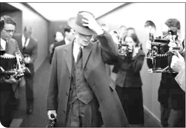
تیزر «اوپنهایمر»، ساخته جدید «نولان» که برخلاف فیلم‌های قبلی او، روایتی تاریخی است در حالی منتشر شد که از جزئیات این ساخته کریستوفر نولان پرده برداشته است. به گزارش ایسنا به نقل از ددلاین، این

فیلم سینمایی برای اکران در تاریخ ۲۱ جولای ۲۰۲۳ از سوی کمپانی یونیورسال برنامه‌ریزی شده و این ویدئوی دو دقیقه‌ای نخستین تصاویری است که با جزئیات از ساخته جدید «کریستوفر نولان» پرده برداشته است.