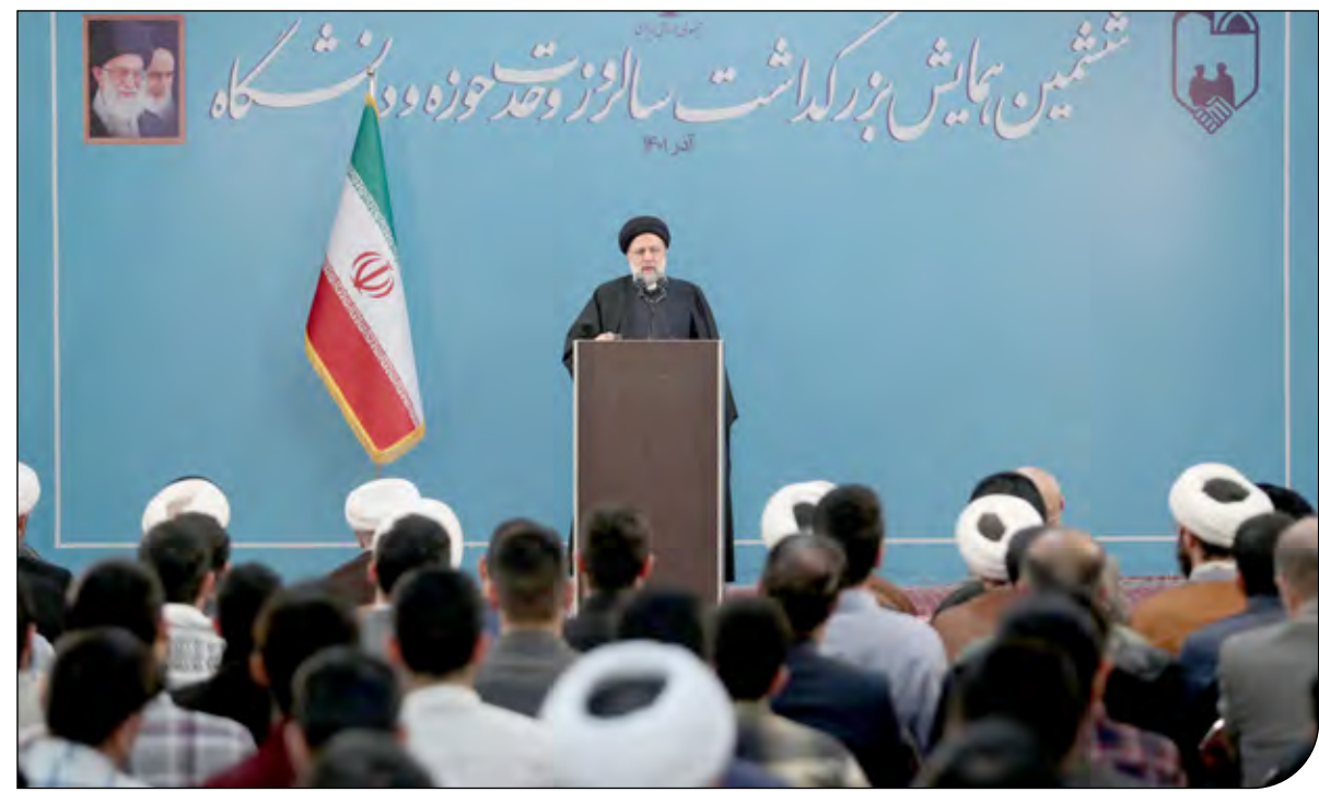
ابراهیم رئیسی در جریان سخنرانی در دانشگاه تهران، ۲۸ آذر ۱۴۰۱

«پیام ما» به بهانه اظهارات ابراهیم رئیسی درباره «رسالت روشنفکری» برخی هشدارهای روشنفکران درباره دلایل اعتراضات را بازخوانی می‌کند