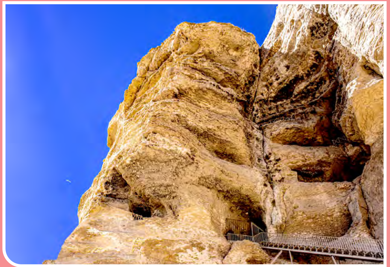
قدیمی‌ترین آپارتمان دست‌ساز دنیا / غار باستانی کرفتو در استان کردستان، حدود ۲ هزار سال پیش توسط ساکنان این سرزمین به زیبایی کنده‌کاری شده و اکنون به عنوان قدیمی‌ترین آپارتمان دست‌ساز دنیا در فهرست آثار جهانی یونسکو پذیرش شده است. / عکس از فرید باوه