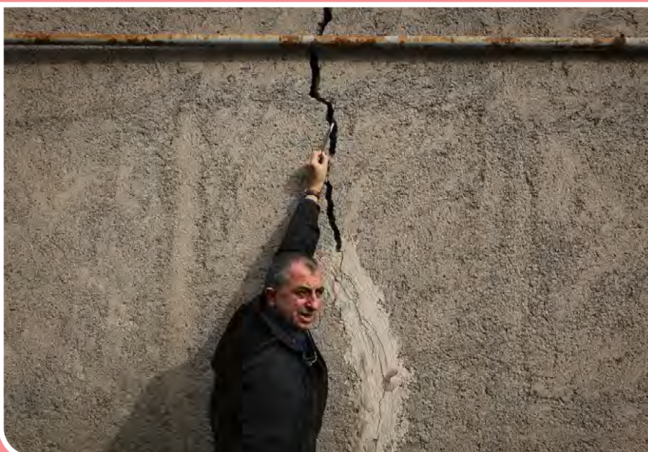
فرونشست زمین؛ زلزله خاموش در پایتخت/ فرونشست زمین که از آن به عنوان زلزله خاموش نیز یاد می‌شود، پدیده‌ای است که چند سالی می‌شود نامش با گوشمان آشناست. حالا با حساس شدن شرایطی که فرونشست زمین در کشور ایجاد کرده، کمتر کسی پیدا می‌شود که با زلزله خاموش آشنا نباشد.