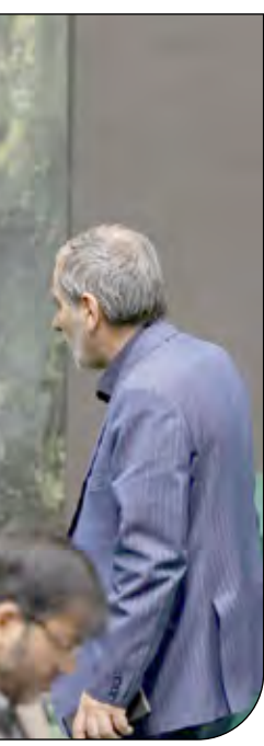
— سید حسن خمینی —

او در ادامه ادعاهایش افزود: ما مصمم به جلوگیری از دستیابی ایران به سلاح هسته‌ای هستیم و همچنان معتقدیم دیپلماسی بهترین راه برای جلوگیری از دستیابی ایران به سلاح هسته‌ای است. سخنگوی وزارت خارجه آمریکا در عین حال بار دیگر با اذعان به اینکه در حال حاضر مذاکرات برجام در دستور کار نیست و کشورش بر نارآمی‌های ایران متمرکز است و مدعی شد ما بر حمایت از معترضان در سراسر ایران و پاسخگو کردن مقاماتی که مسئول سرکوب بی‌رحمانه اعتراضات هستند، متمرکز هستیم. ند پریلس با ادعای حمایت از حق مردم ایران برای ابراز خواسته‌های خود، نقش واشنگتن را در نارآمی‌های ایران مدعی و مدعی شد که نارآمی‌ها به آمریکا ربطی ندارند اما این کشور از مردم خود هراس دارد.