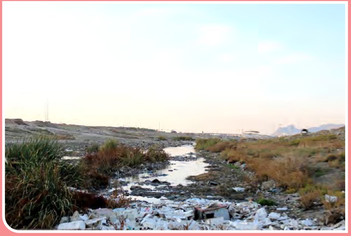
«قره سو» رودخانه‌ای است که در دشت کرمانشاه جریان دارد و از درون شهر کرمانشاه می‌گذرد و این رود از سراب روانسر در شمال غرب کرمانشاه سرچشمه گرفته و پس از عبور از این شهر در منطقه فرمان به رود گاماسیاب می‌ریزد. رودخانه «قره سو» طی سال‌های گذشته با مشکلات بسیاری مانند ورود فاضلاب شهری به آن و تخلیه نخاله در آن روبه‌رو بوده که مشکلات محیط زیستی را برای آن رقم زده است.