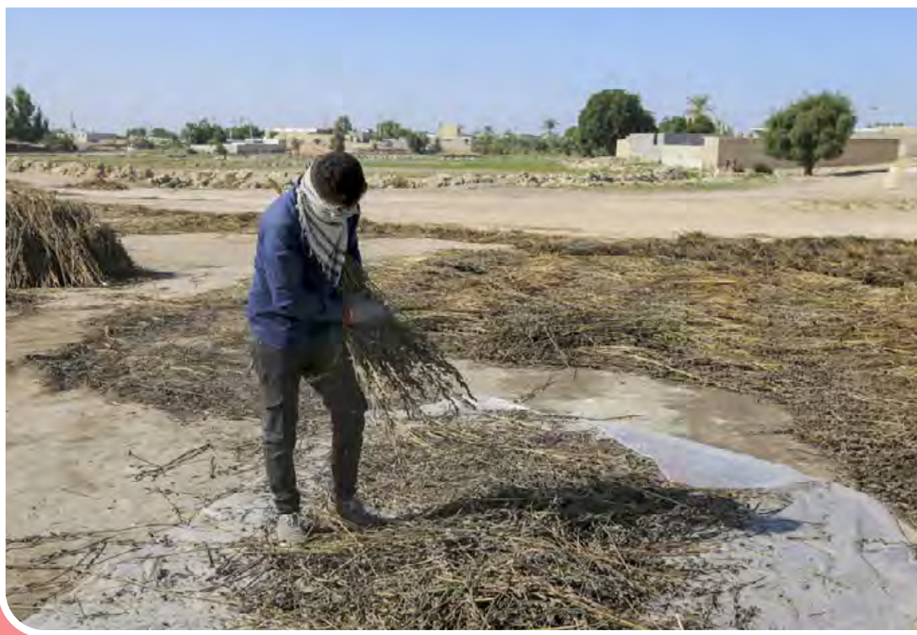
تیندین به گویش لری به معنای تکاندن بوده که آخرین مرحله سنتی برداشت کنجد است. در فصل پاییز و با دروی گیاه کنجد و پس از خشک شدن گیاه زیر نور آفتاب در این مرحله، گیاهان را دسته کرده و با تکان و ضربه سعی بر خروج دانه‌های گیاه (کنجد) می‌کنند.