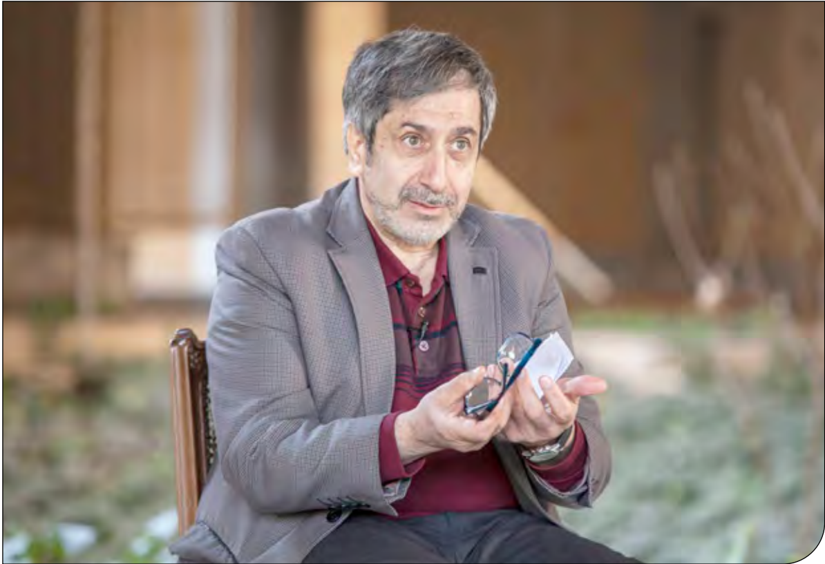
سید امانی | سید امانی

وزیر خارجه پیشین آمریکا اظهار کرد که واشنگتن با خروج ترامپ از برجام، چشم‌های خود در ایران را از دست داد. به گزارش ایسنا، به نقل از سی ان ان، هیلاری کلینتون، وزیر خارجه پیشین آمریکا روز جمعه با اشاره به ناآرامی‌های اخیر ایران عنوان کرد: من بודم سر هیچ مسئله‌ای از جمله مذاکرات هسته‌ای به تعامل با ایران نمی‌پردازمخ. در دو ادامه گفت: زمانی که ترامپ ما را از توافق خارج کرد، ما چشم‌هایی که در ایران داشتیم تا نظاره کنند که آن‌ها چه کارهایی انجام می‌دهند، را از دست دادیم. باور دارم که ایرانیان سانتزیفیوژهای‌شان را بار دیگر راه انداخته باشند. کلینتون در ادامه گفت تا زمانی که «مردم ایران در حال ایستادگی هستند»، واشنگتن نباید نشان دهد که «به دنبال توافق است».