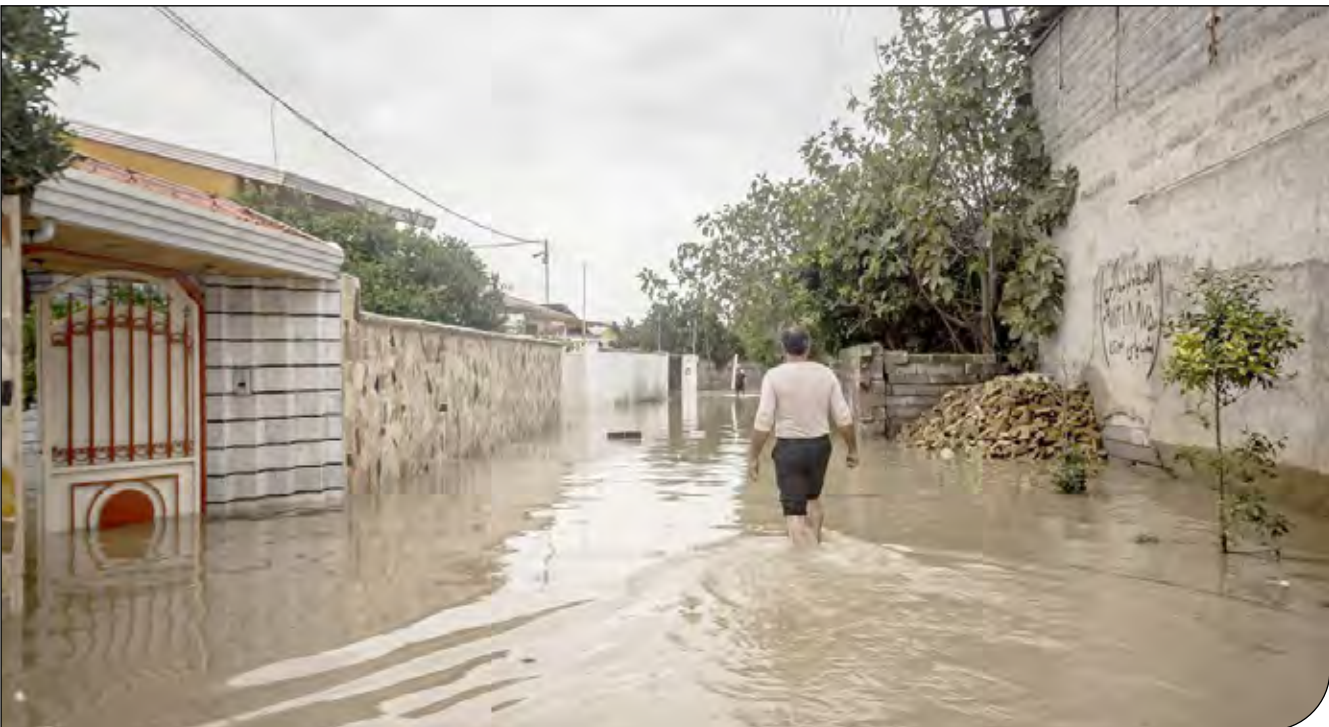
باشگاه خبرنگاران جوان -

تدوین و اجرای طرح‌های جامع مدیریت پسماند شهری با تاکید بر مدیریت در شرایط اضطراری به منظور جلوگیری از آلودگی منابع آبی و گرفتگی آبراهه‌ها و با تکیه بر آموزش‌های عمومی و تخصصی می‌تواند به بهبود شرایط محیط زیستی منجر شود