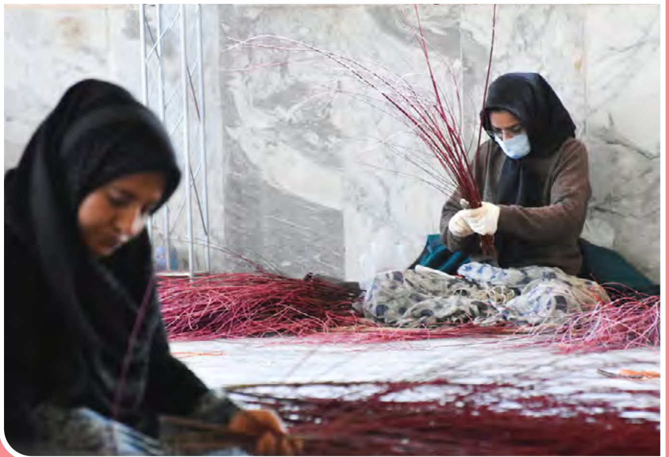
بید سرخ / بید سرخ محلات به طلای سرخ استان مرکزی معروف است. ریشه‌های اصلی این درخت همیشه به دنبال منبع آب هستند و ممکن است به لوله‌های دفن شده در زمین آسیب برسانند. ریشه‌های این درخت ممکن است آنقدر بلند شوند که پیاده‌روهای نزدیک درخت را نیز در بر بگیرند. / عکس از بهنام یوسفی