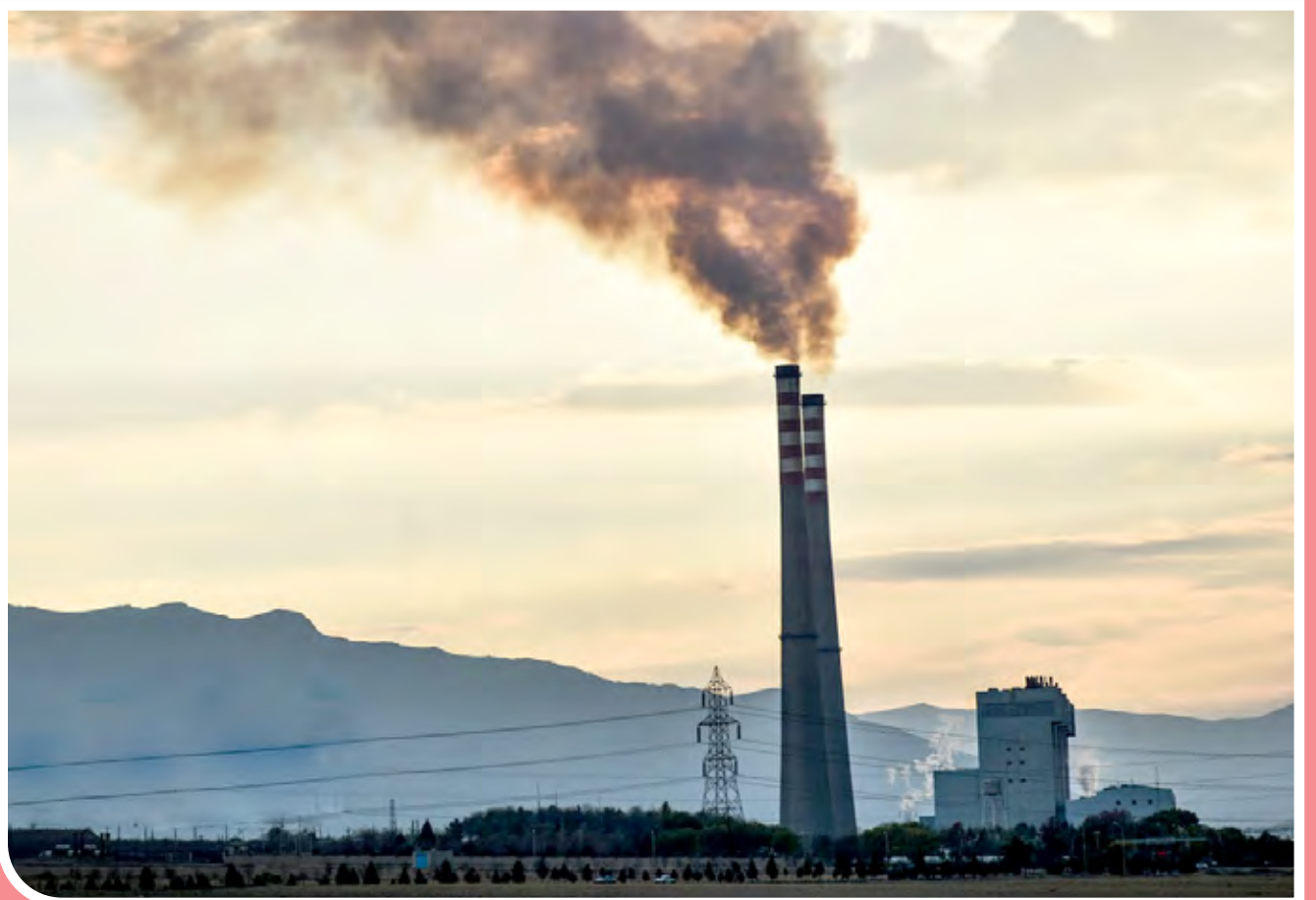
مازوت‌سوزی نیروگاه اراک / این روزها مازوت متهم اصلی آلودگی هوای اراک است چراکه هرساله با شروع فصل سرما مازوت‌سوزی نیروگاه اراک آغاز شده و باعث آلودگی شدید شهر می‌شود.