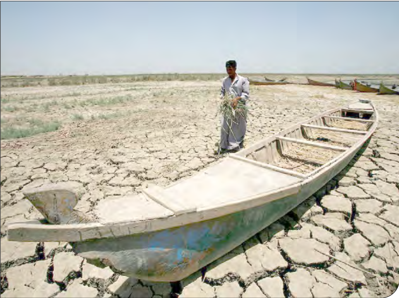
— — —

حوزه‌های کشاورزی، انرژی، معدن، صنعت، حمل و نقل و ساخت و ساز بیش از سایر مشاغل در معرض تهدید هستند