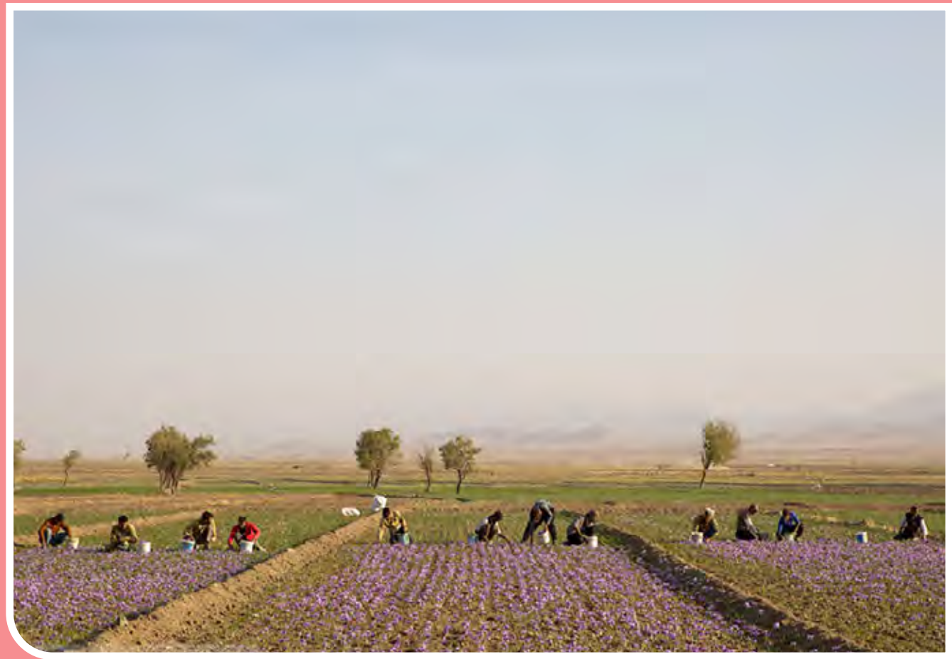
برداشت زعفران از مزارع تربت‌حیدریه و زاوه