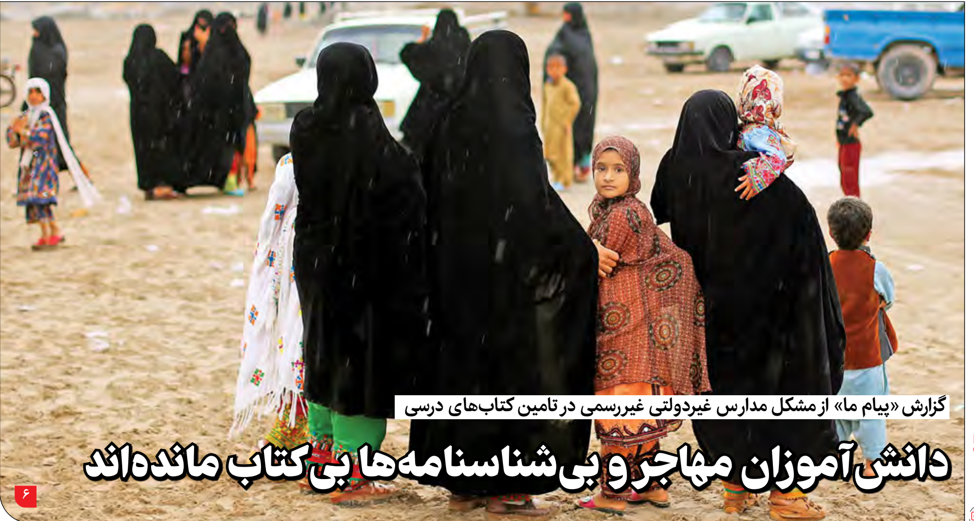
گزارش «پیام ما» از مشکل مدارس غیردولتی غیررسمی در تامین کتاب‌های درسی