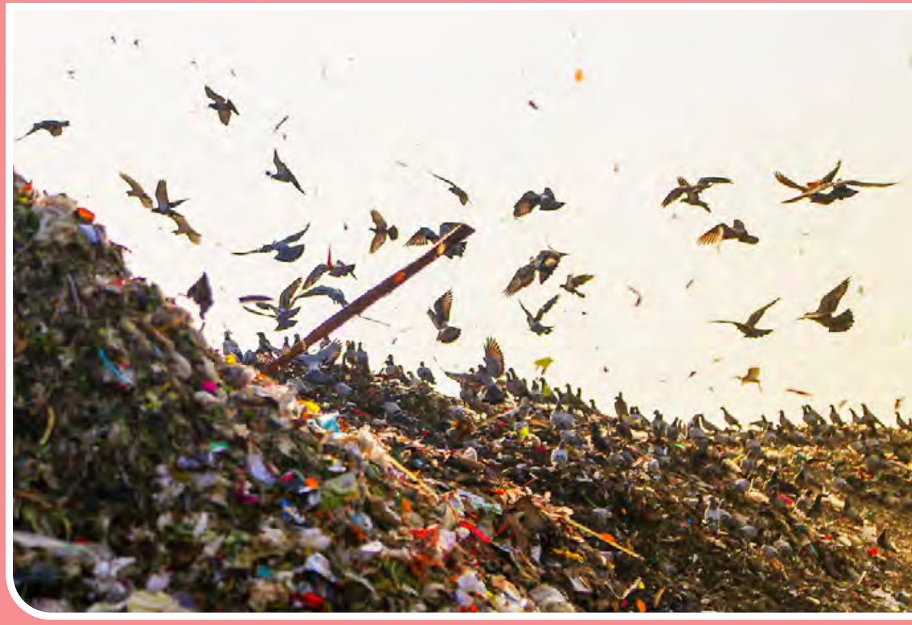
طلای کثیف در آخرین ایستگاه / از شروع سال ۱۴۰۱ روزانه حدود ۱۰۰ تن پسماند در جزیره کیش تولید می‌شود که پس از تفکیک اولیه در محل توسط کیشوندان به سایت بازیافت و پسماند این جزیره منتقل می‌شود در این سایت با تلاش بیش از ۱۱۰ نفر این پسماندها برای بازیافت و برگشت به چرخه تولید تفکیک و جداسازی می‌شود.