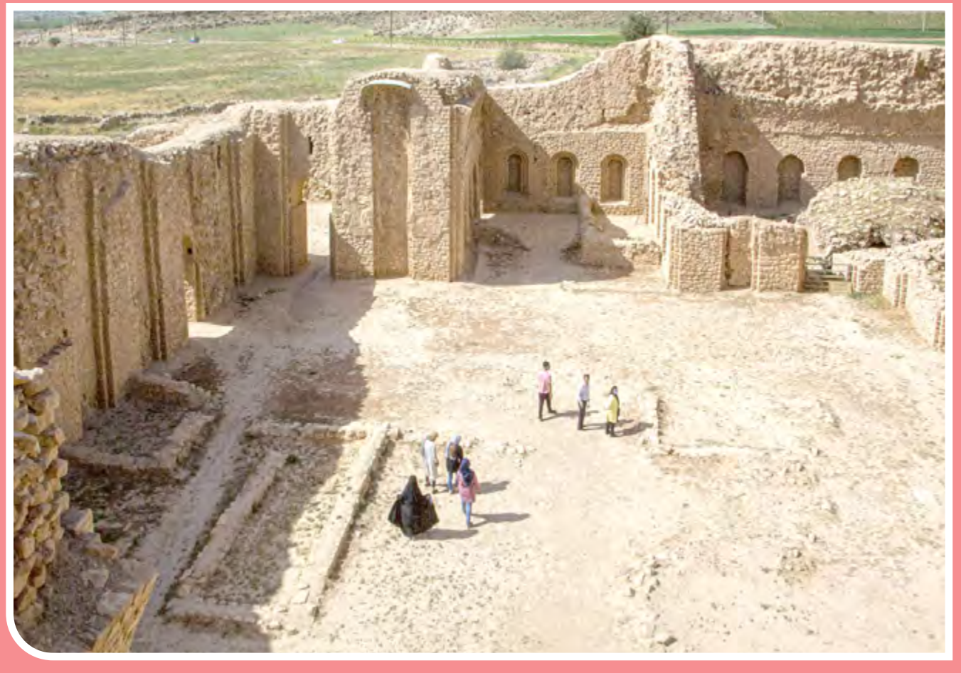
کاخ آتشکده فیروزآباد فارس