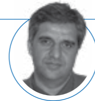
۱۲ مهر ۱۴۰۱ |