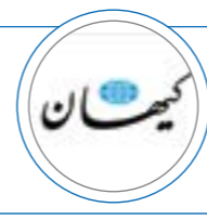
۱۸ مهر ۱۴۰۱ |