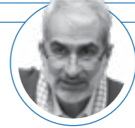
| ۲۰ مهر ۱۴۰۱ |