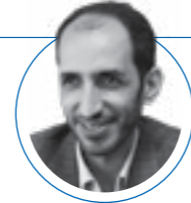
۱۸ مهر ۱۴۰۱ |

لینک: پایگاه اطلاع رسانی شورای عالی انقلاب فرهنگی