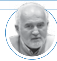
۱۳ مهر ۱۴۰۱ |