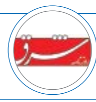
| ۲۰ مهر ۱۴۰۱ |