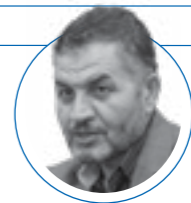
۹ مهر ۱۴۰۱ |