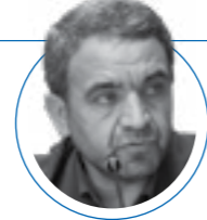
| ۲۱ مهر ۱۴۰۱ |