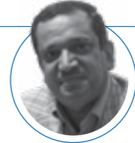
| ۱۹ مهر ۱۴۰۱ |

سرپرست دفتر امور آسیب‌دیدگان اجتماعی سازمان بهزیستی: