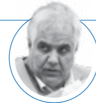
۱۲ مهر ۱۴۰۱ |