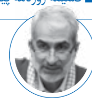
۱۳ مهر ۱۴۰۱ |