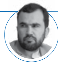
۱۶ مهر ۱۴۰۱ |

دکتر ایمان افتخاری عضو حقیقی شورای عالی انقلاب فرهنگی؛