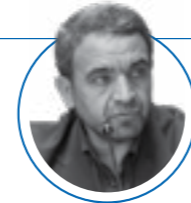
۲ مهر ۱۴۰۱ |