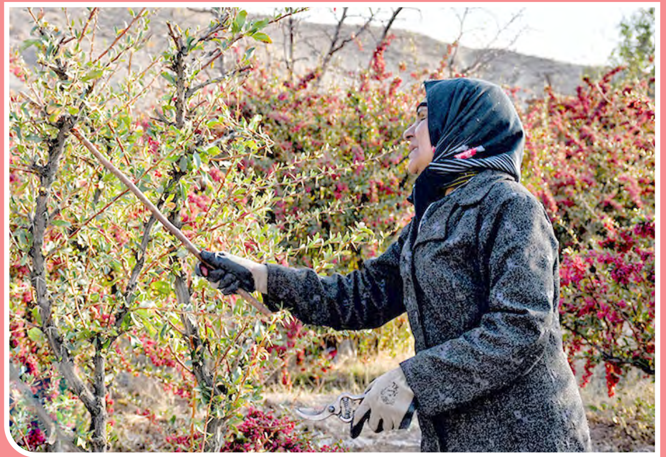
برداشت زرشک در خراسان جنوبی