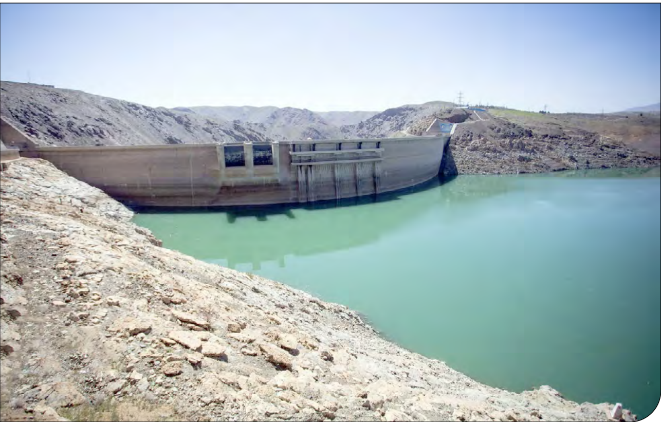
تصویری از سد

او به وجود ۱۱۴ خانه تاریخی در کرمانشاه اشاره کرد و گفت: هرچند که تعدادی از خانه‌های تاریخی در سال‌های گذشته تخریب شده‌اند، اما در حال دسته‌بندی سایر بناهای تاریخی هستیم تا مشخص شود که کدام یک قابلیت سرمایه‌گذاری و درآمدزایی دارند.