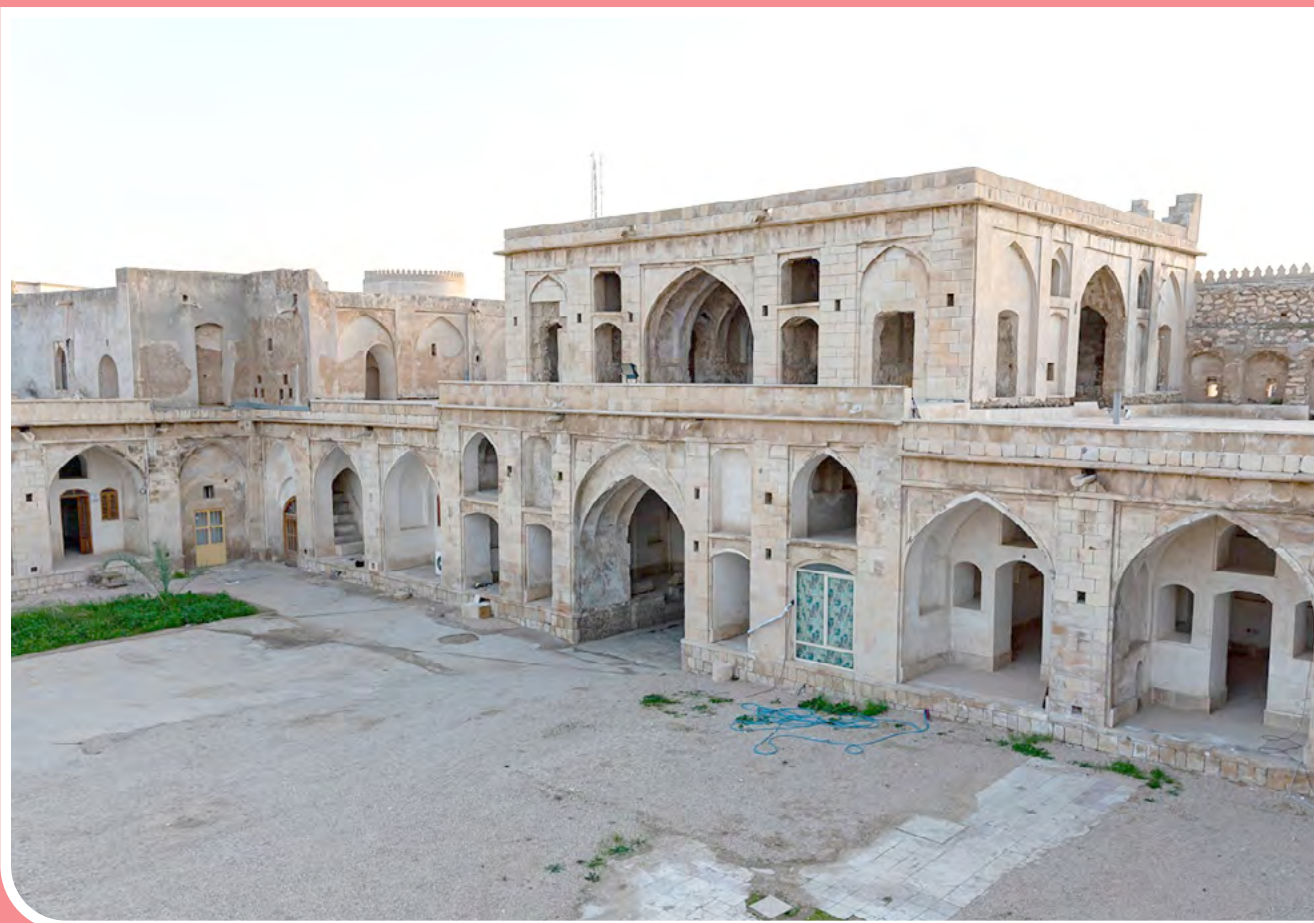
کاروانسرای مشیرالملک - بزازجان