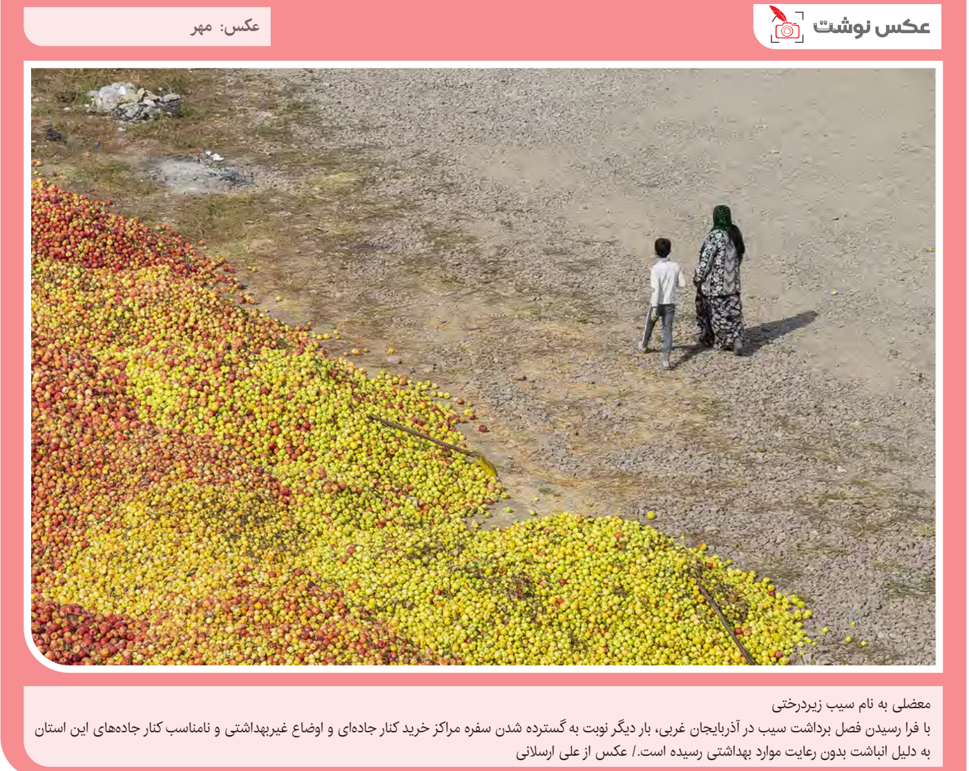
عکس: مهر معضلی به نام سیب زیردرختی با فرا رسیدن فصل برداشت سیب در آذربایجان غربی، بار دیگر نوبت به گسترده شدن سفره مراکز خرید کنار جاده‌ای و اوضاع غیربهداشتی و نامناسب کنار جاده‌های این استان به دلیل انباشت بدون رعایت موارد بهداشتی رسیده است. / عکس از علی ارسلانی

جوزفین ملویل بازیگر تئاتر بریتانیا پس از اجرای نمایش، در پشت صحنه جان باخت. به گزارش مهر به نقل از گاردین، جوزفین ملویل بازیگر و کارگردان ۶۱ ساله تئاتر بریتانیا پس از بازی در نقش خود در «شب در ناتینگهام» پنج‌شنبه شب با ایفای نقشش در نقش شخصیتی به نام «خاله مگی» در خانه نمایش ناتینگهام دچار حمله شد و فوریت‌های پزشکی نیز مؤثر نبود. هنوز دلیل فوت او اعلام نشده است. همکارانش در این نمایش که محصول مشترک ۲ تئاتر ناتینگهام پلی‌هاوس و لیدز پلی هائوس بود، از او به عنوان شخصیتی دوستداشتنی و یک بازیگر، کارگردان، تهیه‌کننده و نویسنده عمیقاً مورد احترام یاد کردند. پس از درگذشت ملویل تمامی اجزای این نمایش لغو شد.