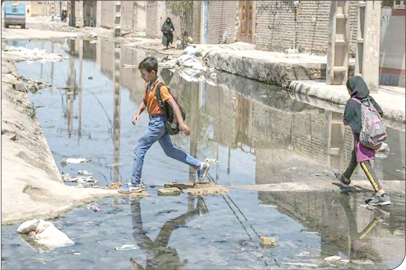
| تصویر |

در سال ۱۳۹۸ رهبرانقلاب برداشت ۵۰ میلیون یورویی از صندوق توسعه ملی را موافقت کرد و اینک نماینده شهر اهواز از مطالبه اعتبار برای فاضلاب اهواز خبر داده است