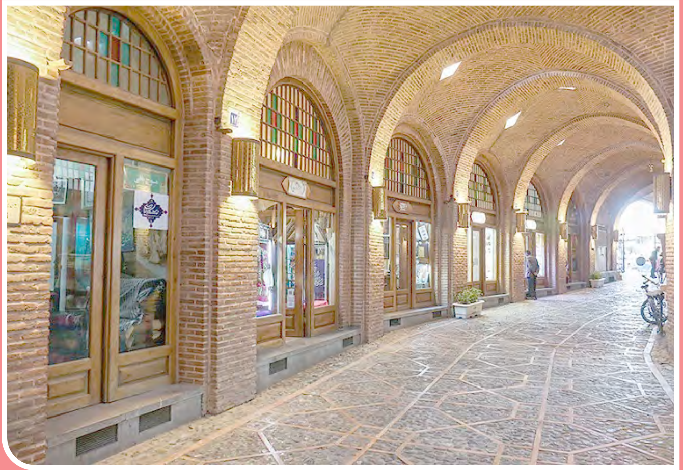
سرای سعدالسلطنه قزوین / سرای سعدالسلطنه قزوین بزرگترین کاروانسرای سریوشیده جهان و همچنین بزرگترین کاروانسرای درون شهری ایران است. این کاروانسرا در نزدیکی بازار شهر قرار دارد که در عهد قاجار و در زمان ناصرالدین شاه توسط سعدالسلطنه شهردار وقت قزوین بنا شده است.