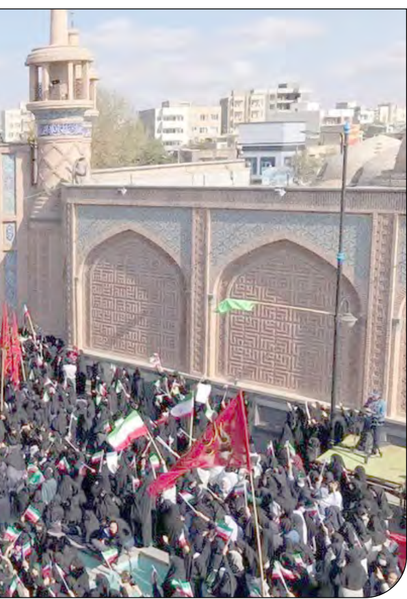
میدان عالی قاپوی اردبیل محل تجمع دانش‌آموزان در روز چهارشنبه ۲۰ تیرماه ۱۳۹۸