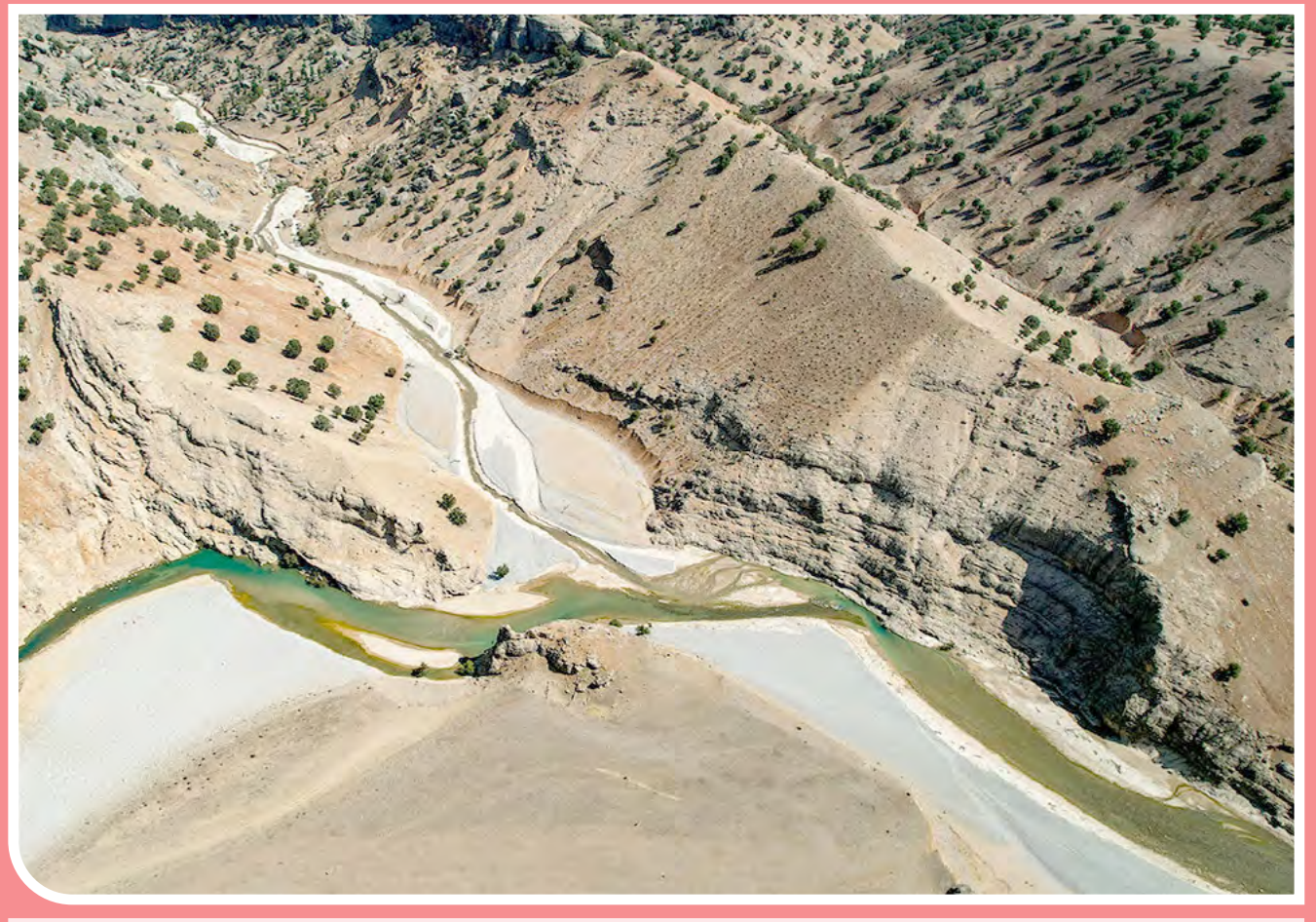
خشکی تدریجی رودخانه بازفت/ رودخانه ۹۵ کیلومتری بازفت که یکی از سرشاخه‌های اصلی رود کارون به حساب می‌آید و تاثیر مستقیم و غیرمستقیم آن در اقلیم و زندگی مردم حاشیه این رود محسوس است، اکنون با خشکسالی کم‌سابقه دست به گریبان است.