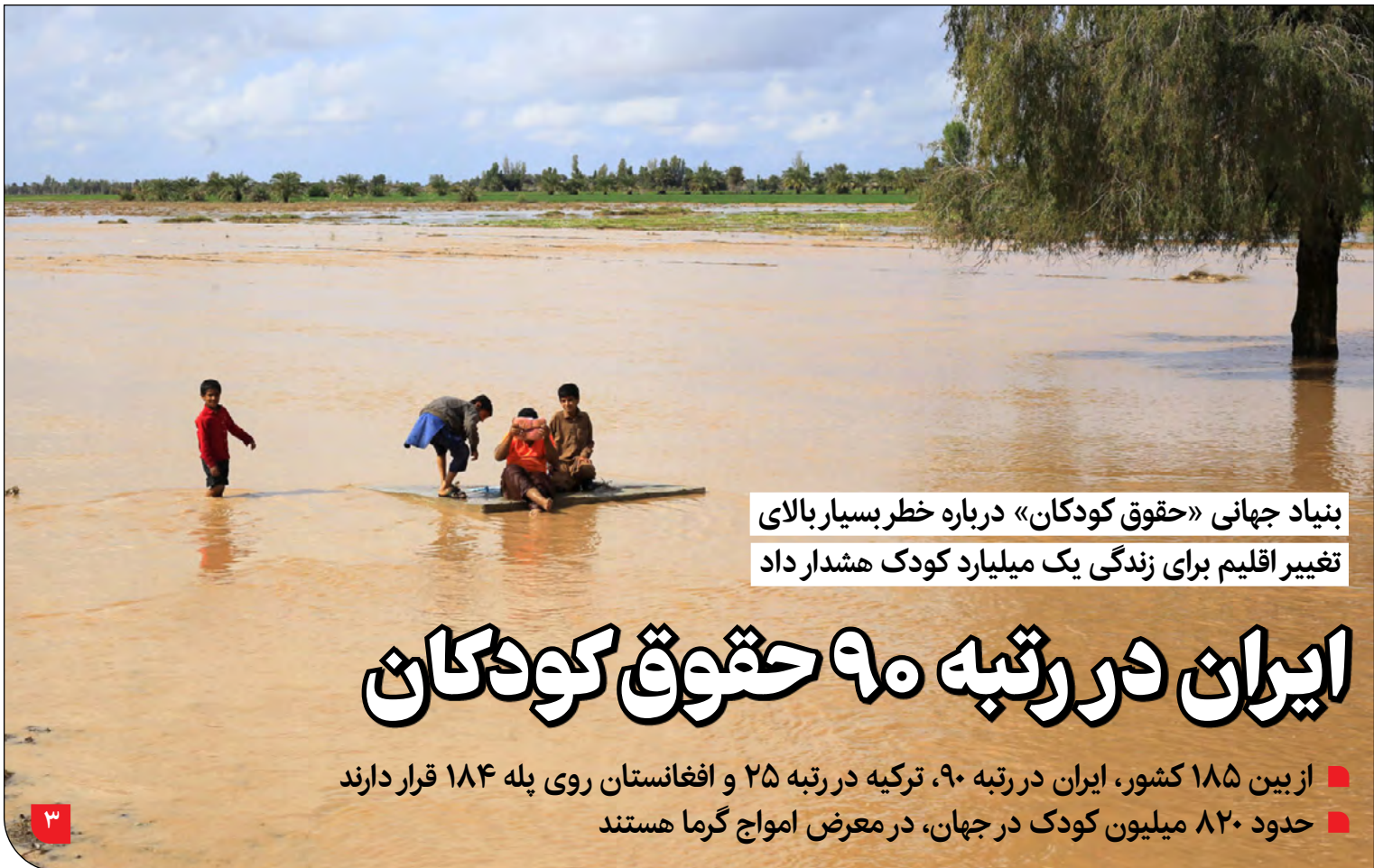
بنیاد جهانی «حقوق کودکان» درباره خطر بسیار بالای تغییر اقلیم برای زندگی یک میلیارد کودک هشدار داد

مهاجرت، نقل مکان مردم از منطقه‌ای به منطقه دیگر برای کار یا معاش تعریف می‌شود. گاهی مهاجرت بنا به تمایل شخص در راستای افزایش سطح زندگی، دستیابی به رفاه نسبی و یافتن شغل مناسب و... است. گاهی نیز شرایط تحمیلی مانند جنگ، بلایای طبیعی، فقر و شرایط نامساعد اقتصادی و سیاسی و فقدان امنیت جانی افراد را بر آن می‌دارد تا از سرزمین خود کوچ کنند. برخی اوقات مهاجرت درون مرزهای یک کشور اتفاق می‌افتد و گاهی مؤلفه‌های فوق، شرایط اضطراری را برای جابه‌جایی اجباری فرد به خارج از مرزهای کشور ایجاد می‌کنند که پناهندگی نامیده می‌شود. یکی از عوامل مهاجرت و پناهندگی یا آوارگی مردم بحران تغییر اقلیم است. تغییر اقلیم با تغییرات بلندمدت در عوامل اقلیمی شرایط عادی ساکنان ادامه در صفحه ۲