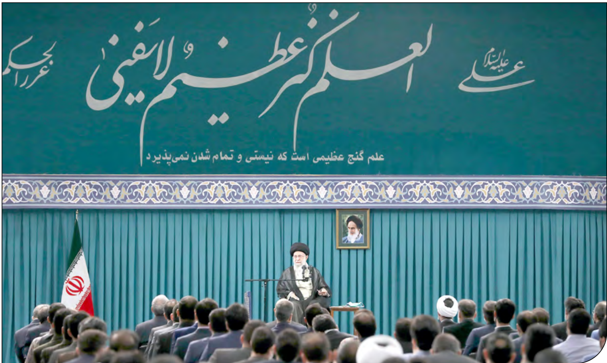
(۶)

وزیر اقتصاد و امور دارایی نیز آخرین تصمیمات دولت را در حوزه جاماندگان سهام عدالت، تشریح کرد و گفت: به جهت اینکه این تکلیف قانون بودجه ۱۴۰۱ است، دولت مصوبه‌ای داشت و در گام اول برای افراد تحت پوشش نهادهای حمایتی مثل کمیته امداد و بهزیستی، ۱۰ میلیون سهام عدالت به ازای هر فرد مصوب و منابع آن مشخص شد و این امر منتظر تاییدیه مجلس است. با احسان خاندوزی با اشاره به روند تبدیل این مصوبه به قانون و لزوم تایید آن از سوی شورای نگهبان عنوان کرد: اگر ایرادی گرفته نشود رسماً ابلاغ و در ماه‌های بعد اجرایی خواهد شد.