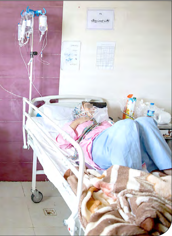
— زن ۹۰ ساله و زن ۸۰ ساله در بیمارستان

برای جهان پیش رو تجربه توفان‌های بی‌سابقه و... مسئله عادی تلقی خواهد شد. پس مهاجرت اقلیمی مقوله بعیدی برای آیندگان نیست. هرچند که نظام حقوقی بین‌الملل کنونی برای محافظت از مهاجران اقلیمی توانمند نیست. زیرا هیچ توافقنامه الزام‌آور قانونی وجود ندارد که کشورها را ملزم به حمایت از آنها کند. بهتر است تعریف نوینی از واژه پناهنده ارائه شود تا مهاجران اقلیمی را نیز در خود بگنجانند. زیرا حمایت‌های قانونی که برای پناهنندگان ارائه می‌شود شامل حال مهاجران اقلیمی نمی‌شود. با وجود اندک برآورد‌های داوطلبانه هیچ تلاش سازمان‌یافته‌ای برای نظارت بر جمعیت مهاجران اقلیمی وجود ندارد. بی‌تدبیری و فقدان تلاش کشورها در این حوزه به طور فزاینده‌ای جامعه بین‌الملل را دچار مشکل خواهد کرد. سیل مهاجرت از مناطقی که کم‌ک‌های بین‌المللی کمی دریافت می‌کنند و مدیریت انرژی و آب و کاربری زمین به‌عنوان شاخص‌های مؤثر برتاب آوری در آنها ضعیف است و اعمال محدودیت‌ها از سوی کشورهای مقصد توازن و نظم بین‌الملل را مخدوش می‌کند. چه‌ا‌لدبیشی زیرلپون تأکید بر تقویت اعطاف‌پذیری و تاب‌آوری در مقابل چالش‌های محیط‌زیستی، بررسی منطقی فشارهای ناشی از تغییر اقلیم بر جمعیت‌های آسیب‌پذیر نه صرفا تخصصی بودجه، بهبود آموزش، سیاست‌گذاری، امنیتی‌کردن مسئله تغییر اقلیم در کشورها و برنامه‌ریزی‌های ملی و اتخاذ رویکردهای راهبردی و یاری‌های توسعه محور دوجانبه و چندجانبه و دیپلماسی محیط‌زیستی یک اولویت دراستی رفغ این مسئله جهانی است.