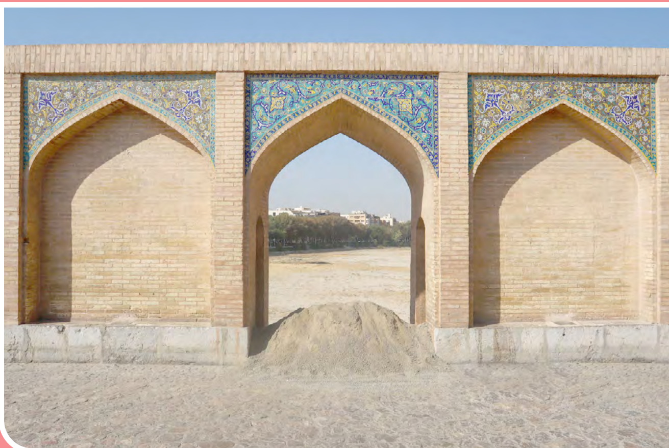
خواجو زیر تیغ جان‌پناه

مدتیست هفده دهانه از یال جنوب شرقی پل خواجو به منظور نصب جان‌پناه در دهانه‌های بالایی پل به محیط کارگاهی تبدیل شده است. در پروژه «جان‌پناه پل خواجو»، قرار است پشت هر ستون پل یک میله توسط سیم بکسل نصب و از طرفی کف، پی‌ها، جدارها به‌ویژه قله‌گاه‌های پل بازسازی شود.