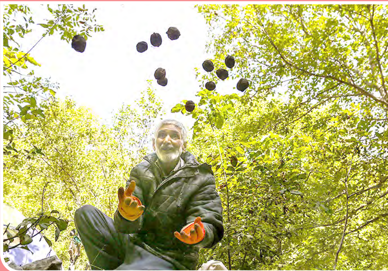
برداشت گردو- درگز