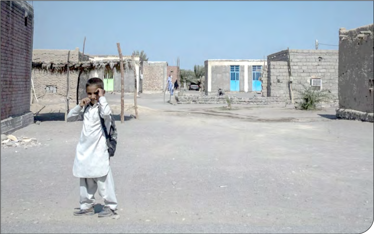
پیام ۸ - ۱۳۹۱