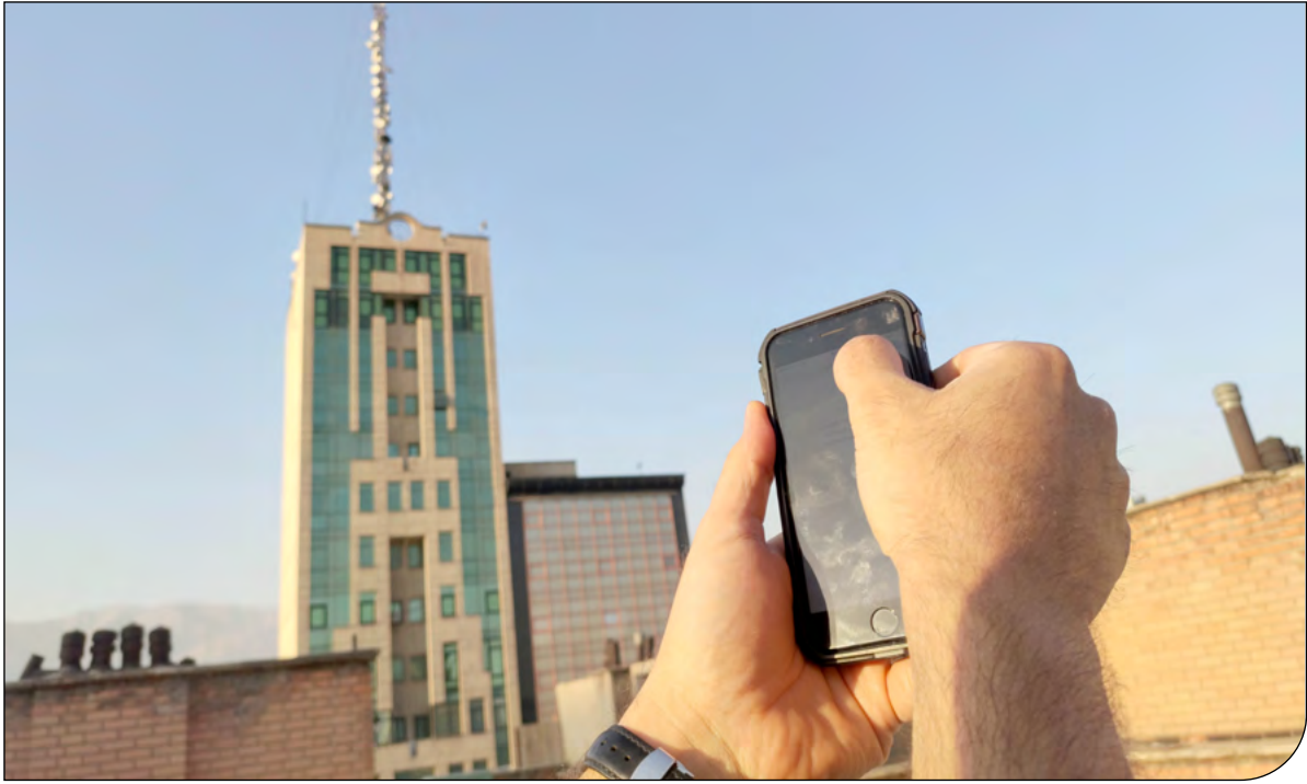
— پیام ما —