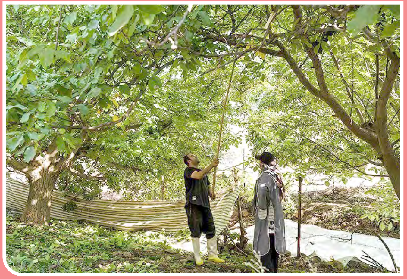
برداشت گردو از باغات شهر الشتر