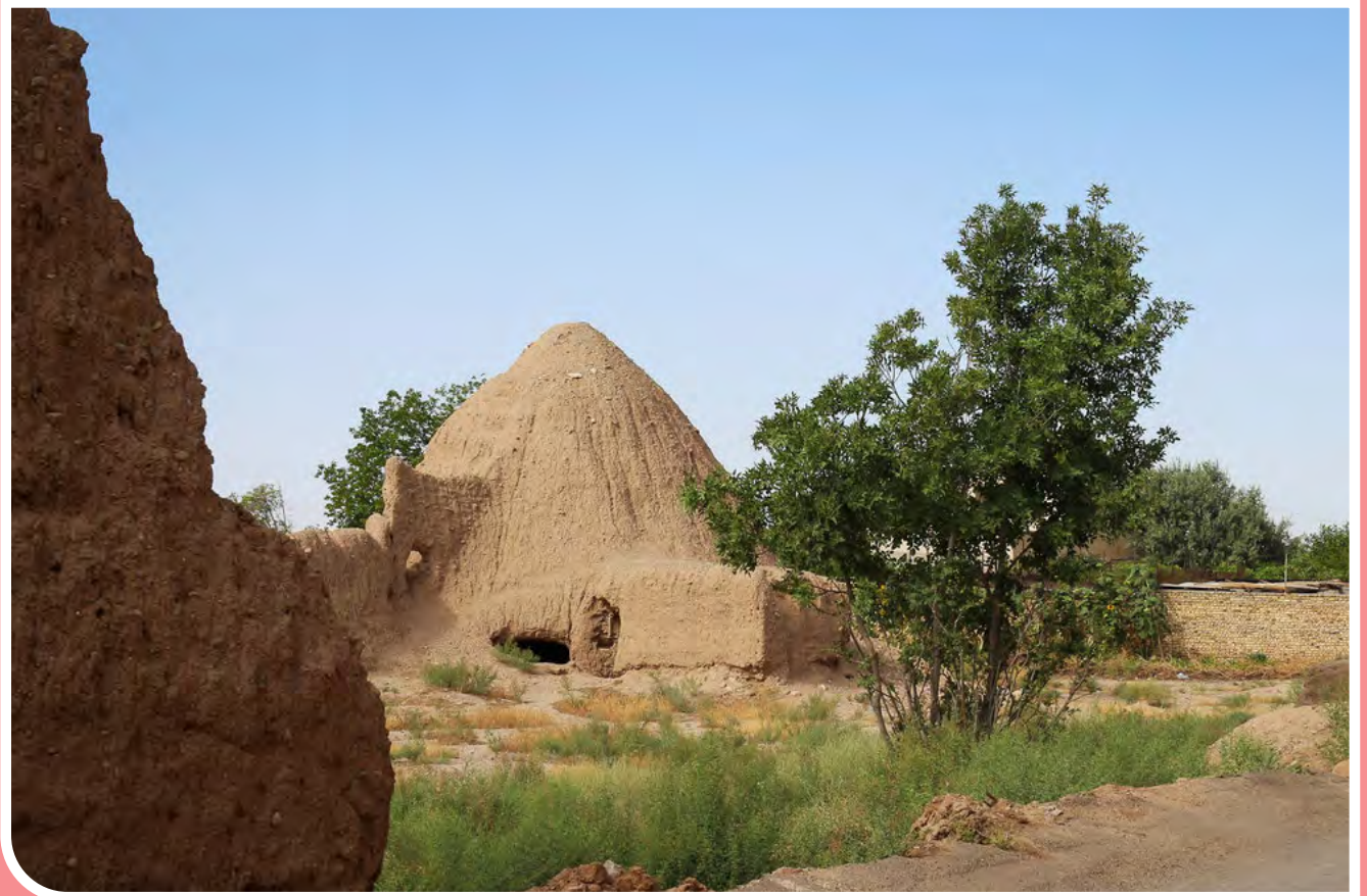
آخرین بازماندگان یخچال‌های سمنان این یخچال‌ها بیشتر در شهرهای کویری ایران با معماری مخروطی شکل به چشم می‌خورند. شهر کویری سمنان نیز دارای یخچال‌های متعددی بود که پنج عدد از آنها در سال ۱۳۸۱ به عنوان آثار به جا مانده از دوره قاجار ثبت شد و در حال حاضر چهار یخدان در فضای شهر باقی است و دیگری به کلی تخریب شد.