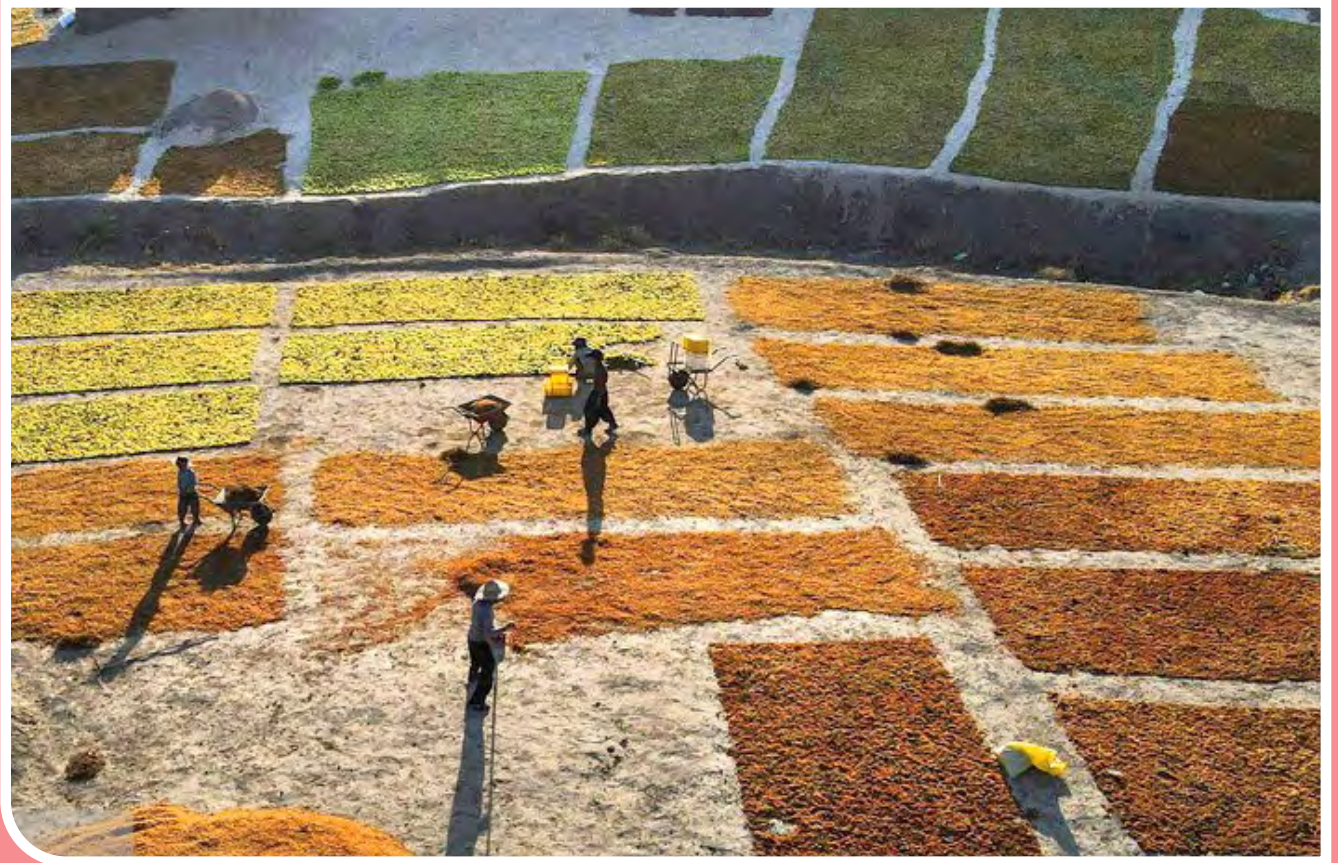
دره «جوزان» - ملایر / هر سال از اواخر تابستان، برداشت انگور در منطقه «دره جوزان» شهرستان ملایر و روستای «توسک» و «جوزان آغاز» می‌شود. شهرستان ملایر با وجود دارا بودن بیش از ده هزار هکتار باغات و تاکستان‌های انگور سهم عمده‌ای را در تولید و صادرات کشمش در استان و حتی کشور بر عهده دارد. اما با این وجود هنوز هم کشاورزان این شهرستان از روش سنتی خشک کردن و تیزاب زدن انگور بر روی کاهگل و در فضای باز برای خشک کردن این محصول استفاده می‌کنند.