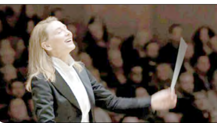
«تار» درخشش کیت بلانشت در ونیز اما تشویق ۶ دقیقه‌ای نصیب فیلم

«تار» با بازی کیت بلانشت شد. هفتاد و نهمین جشنواره فیلم ونیز در اولین روز از ماه سپتامبر شاهد نمایش فیلم جدید تاد فیلد با عنوان «تار» با بازی کیت بلانشت در نقش آهنگساز معروف و اولین رهبر ارکستر زن آلمانی بود. در پایان فیلم در حالی که تماشاگران در سالن سالارگرنده سر پا ایستاده بودند، به مدت ۶ دقیقه فیلم، کارگردان و بازیگرانش را تشویق کردند. به نظر می‌رسد «تار» یکی از پرطرفدارترین فیلم‌های فصل اسکار باشد. از نقدهایی که بر این فیلم نوشته شده برمی‌آید که بلانشت برای هشتمین بار نامزدی اسکار را کسب کند. فیلم «تار» که از ۷ نوامبر در سینماها به نمایش