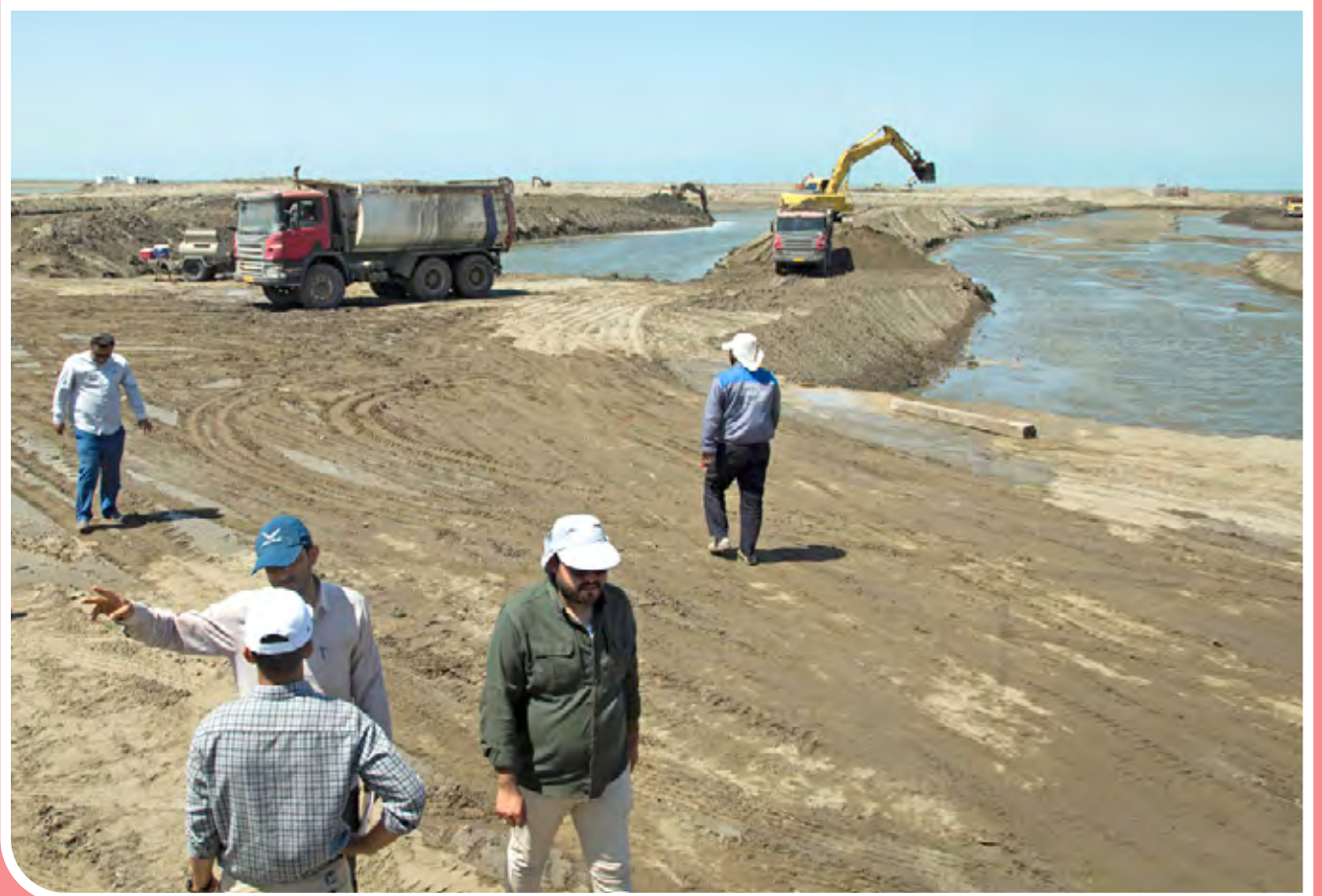
عملیات لایروبی خلیج گرگان / عملیات لایروبی خلیج گرگان از دهانه کانال آشوراده به طول ۹ کیلومتر با عرض ۲۰۰ متر با فعالیت دستگاه «کاتر ساکشن» به عنوان یکی از وعده‌های سفر استانی دولت سیزدهم با فعالیت ۴۰ دستگاه انواع ماشین آلات سنگین صبح سه شنبه (۸ شهریور ۱۴۰۱) به طور رسمی آغاز شد.