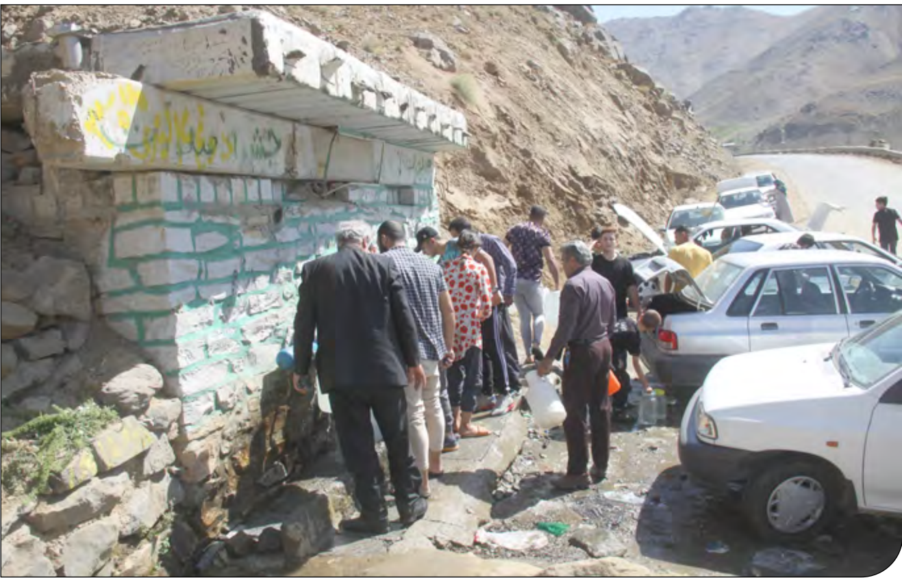
— ۳ —

مسئولان می‌گویند کدورت آب به معنای آلودگی آن نیست و به زودی رفع می‌شود