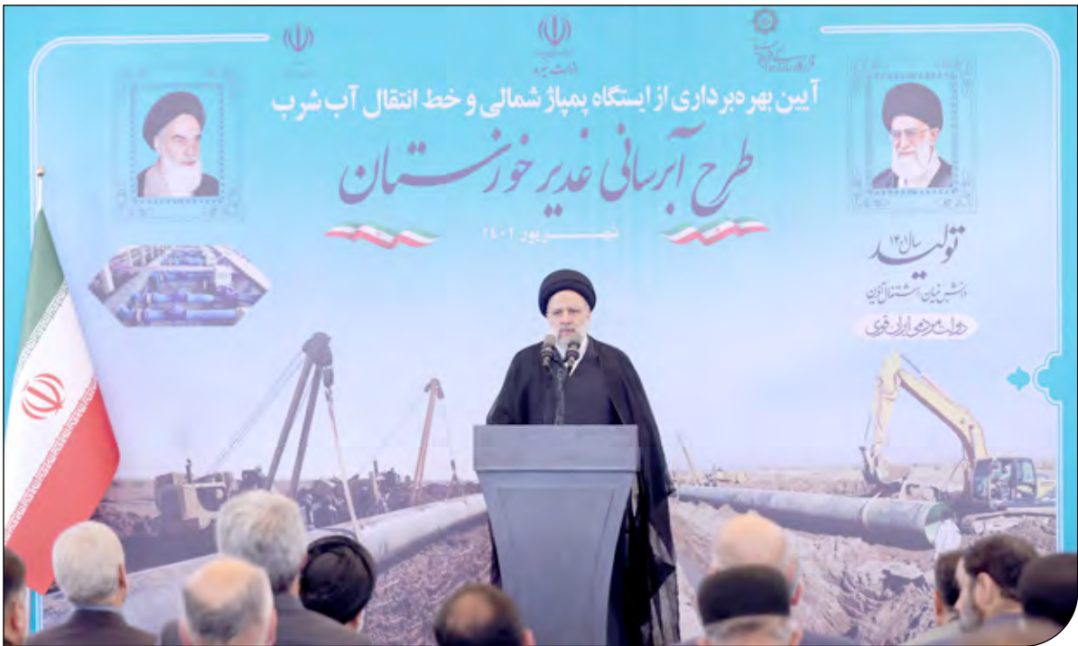
| ریاست جمهوری |

| سال شانزدهم | شماره پیاپی ۲۳۷۶ | شنبه ۱۲ شهریور ۱۴۰۱ |