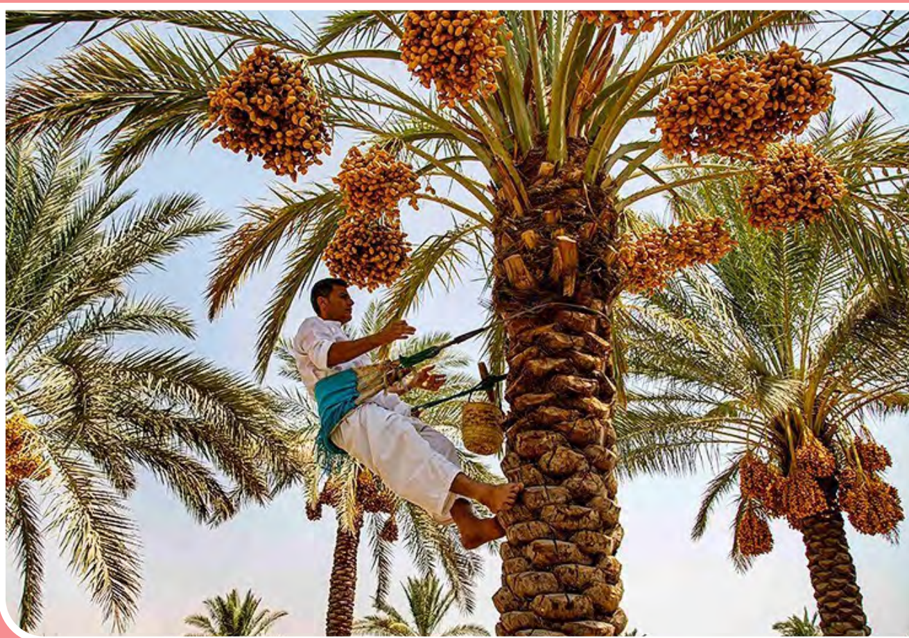
برداشت خرما در منصوره عاصی - شادگان