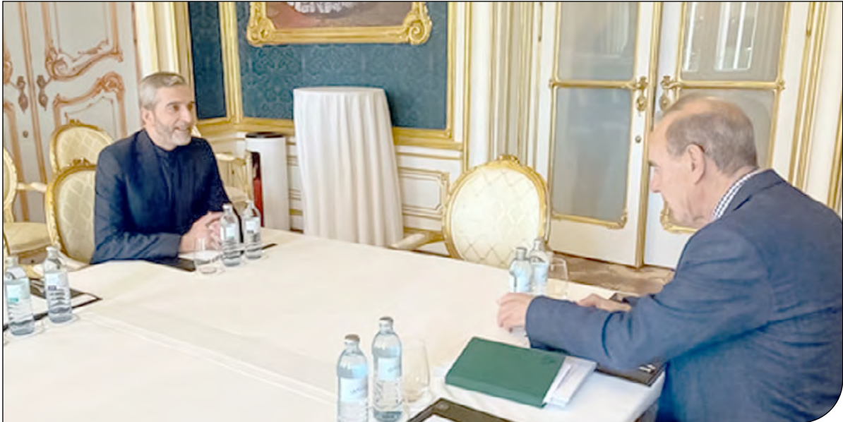
ایران | 16

نایب رئیس مجلس شورای اسلامی در نشست با مسئولان وزارت نفت از تعیین تکلیف موضوع قیر حواله‌ای برای سال ۱۴۰۱ خبر داد. به گزارش خبرنگار پارلمانی ایرنا، علی نیک‌زاد نمرین در توضیح نشست روز دوشنبه (۲۴ مردادماه) با مسئولان وزارت نفت به خبرنگاران گفت: برای تعیین تکلیف قیر حواله‌ای جلسه‌ای با حضور وزیر نفت و معاونان وی، رئیس کمیسیون عمران مجلس و تعدادی از نمایندگان انجام شد که بر اساس نامه‌ای که از دیوان محاسبات به وزارت نفت ارسال شده بود، باید این موضوع تعیین تکلیف شود. نایب رئیس مجلس شورای اسلامی افزود: بر این اساس باید تا شهریور ۱۴۰۱میزان ۱۵ هزار میلیارد تومان وکیوم باتومی طبق قانون برای دستگاه‌های اجرایی ذیل قانون بودجه سال ۱۴۰۱ داده می‌شد. در این جلسه مقرر شد تا شهریور ماه سال جاری، مانده قیرهای حواله‌ای که صادر شده توسط وزارت نفت اقدام شود. او بیان کرد: انتظار می‌رود دستگاه‌های اجرایی ذیل قانون بودجه سال ۱۴۰۱ همچون وزارت راه و شهرسازی، سازمان راهداری، حمل و نقل جاده‌ای کشور و سازمان شهرداری‌ها و دهیاری ها و سایر دستگاه‌های اجرایی برای این امر یک وقت ویژه‌ای در نظر بگیرند و قیر حواله‌ای را قبل از پایان فصل کاری به آسفت‌ات در محلی که وظیفه سازمانی دارند تبدیل کنند.