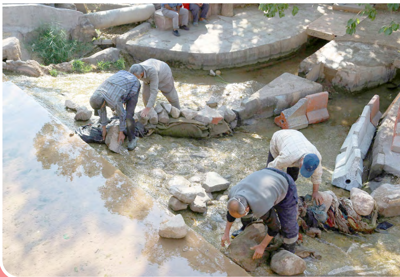
مهندسی هزار ساله تقسیم آب در سمنان / نظام تقسیم سنتی آب در سمنان به حدود هزار سال پیش بازمی‌گردد و شیخ علاءالدوله سمنانی از سران ایلیاتی که سپس از عارفان به نام ایران شد در هفتصد سال پیش ساماندهی و مهندسی این تقسیم را که تا به امروز نیز ادامه دارد انجام داده است.