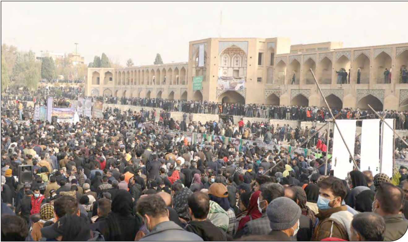
- ۳ -

گزارش مرکز پژوهش‌ها نشان می‌دهد بسیاری از پدیده‌های مخرب محیط زیست در نحوه حاکمیت قانون، مشارکت مردم و رفتار اقتصادی دولت ریشه دارد