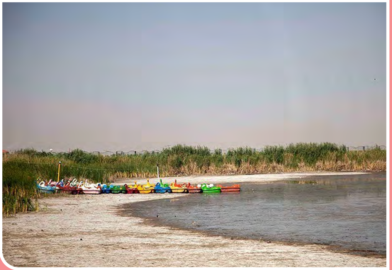
مرگ تدریجی سراب نیلوفر - کرمانشاه