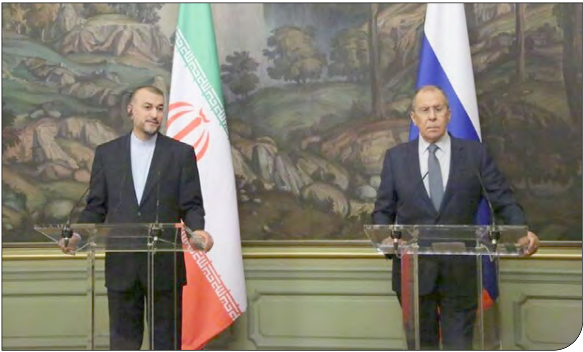
— تنظیم —