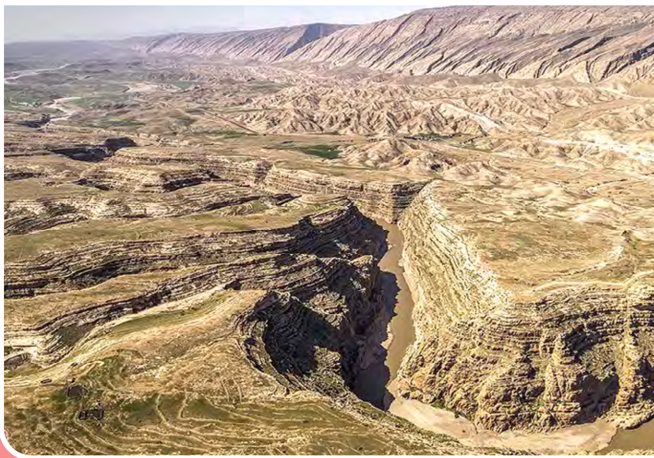
دره خزینه شهرستان پلدختر - لرستان / دره خزینه که در اثر فرسایش و طی سالیان دراز به شکل شگفت انگیز کنونی در آمده است، در میانه جاده پلدختر به سمت اندیشک قرار گرفته است.