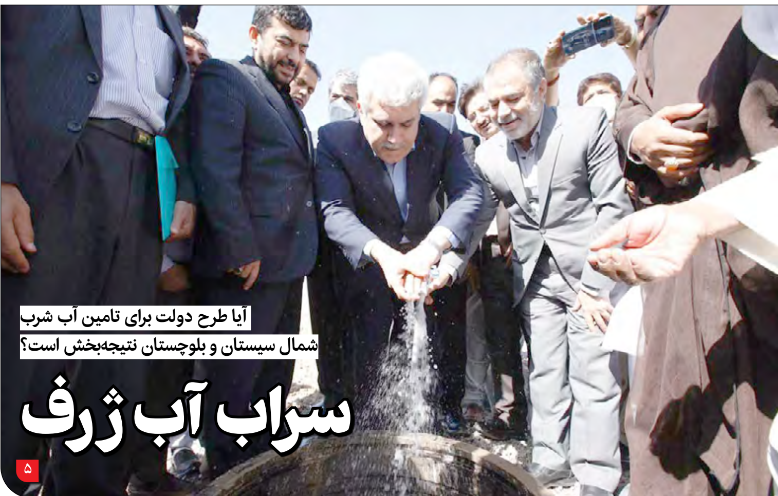
آیا طرح دولت برای تامین آب شرب شمال سیستان و بلوچستان نتیجه‌بخش است؟

حشمتی، معاون محیط زیست انسانی: مدیریت منابع آب، استفاده از آب‌های بازیافتی و بازچرخانی آب اولویت ما است