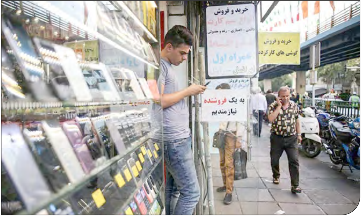
خرید و فروش

برخی منابع از فیلترینگ بعضی پسوندهای دامنه در متن پیامک‌های تلفن همراه خبر داده‌اند