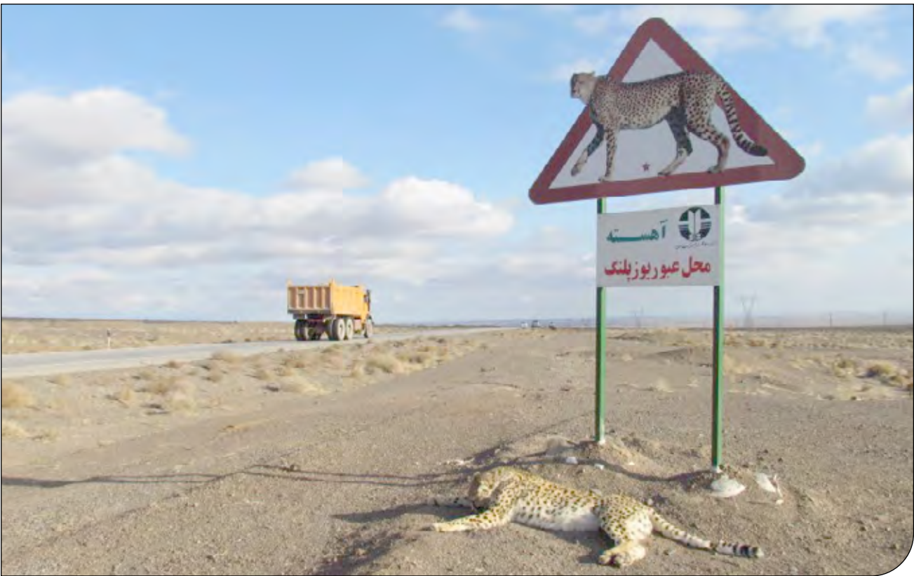
۱ شهریور ۱۴۰۱

سرپرستی کاوش‌های قدیمی‌ترین محوطه باستانی ایران با اشاره به قدمت لایه‌های این فصل از کاوش‌ها، عنوان کرد: در این فصل، نتایج سن‌سنجی مواد فرهنگی این غار که در فصل دوم به آزمایشگاه سن‌سنجی در موزه انسان‌شناسی پاریس ارسال شده بود، نشان دهنده سه لایه استقراری با قدمت‌های ۱۶۰، ۲۱۰ و بالای ۴۰۰ هزار سال برای غار قلعه‌کرد بود که این محوطه را به قدیمی‌ترین محوطه باستانی ایران تبدیل کرد.