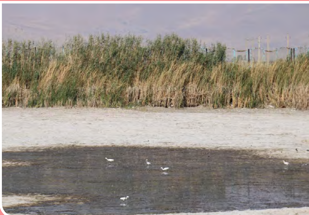
به شمار افتادن نفس‌های سراب نیلوفر کرمانشاه