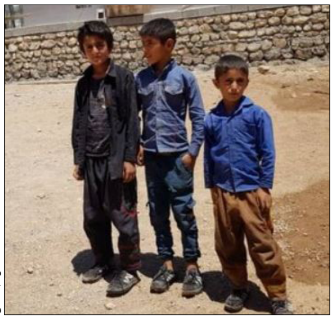
عکس: اید سفلی