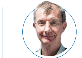
کوبین واتکینز (استاد دانشکده اقتصاد لندن)