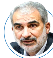
یوسف نوری (وزیر آموزش و پرورش)