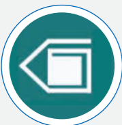
انجمن ایرانی مطالعات فرهنگی و ارتباطات