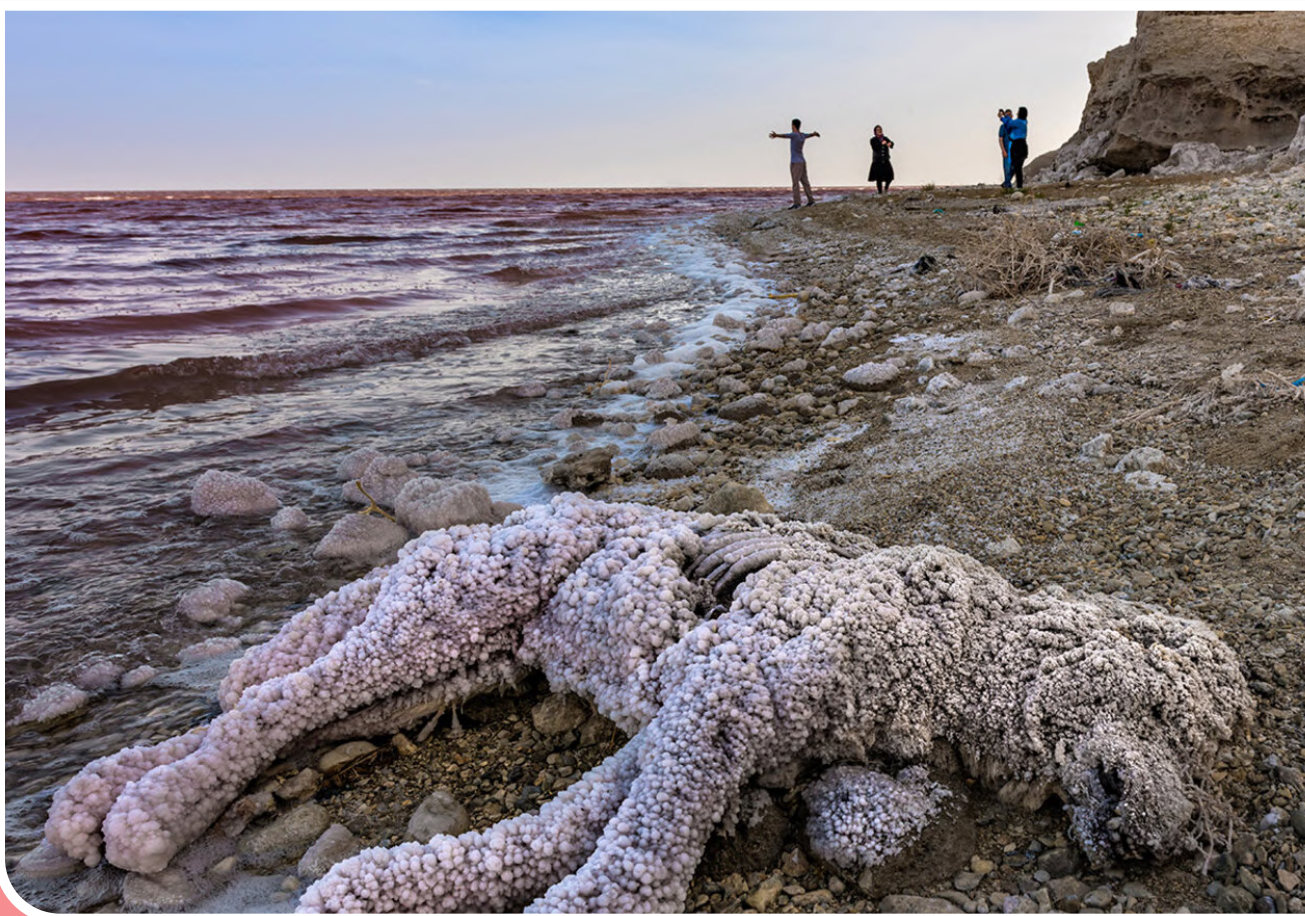
نفس‌های آخر دریاچه ارومیه