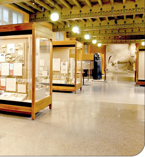
— شهری —