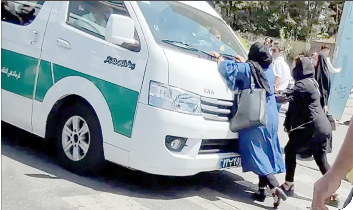
— جمهوری آلبان | 1

بارها و بارها توجه به این موارد را گوشزد کرده است، ولی متأسفانه بازخورد درخوری را از سوی مسئول دریافت نکرده است. ارداهی برای کاهش و ازین بردن این پدیده شوم به چشم نمی‌خورد و گویا تلاش مسئولان پاک کردن صورت مسئله و مخفی کردن مشکلات در این زمینه است. خط اوژانس اجتماعی و خط‌های ارتباطی برای کمک به کودکان در این زمینه باید فعال‌تر شوند و توسط رسانه‌ها به کودکان اطلاع رسانی شود. وظیفه رسانه ملی و همه فیلمسازان و یاران رسانه است که آموزش مهارت خودمراقبتی را در دستور کار خود قرار دهند. کودک آزاری و به ویژه کودک‌آزاری جنسی ابعاد پیچیده و گسترده‌ای دارد و بدون مساعدت همگانی نمی‌توان مبارزه با این پدیده را پیش برد.