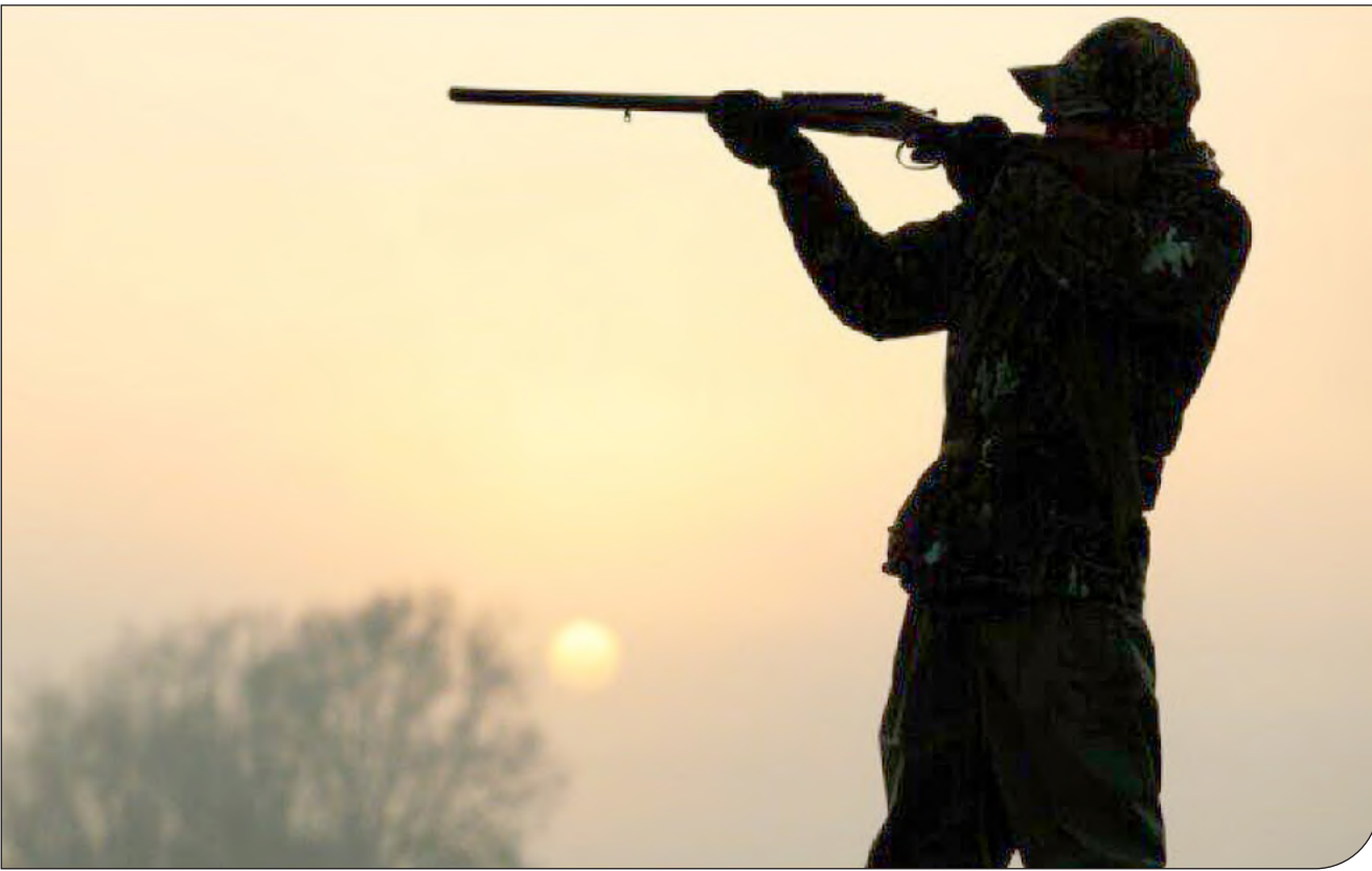
تصویری از متهم در حال هدف قرار گرفتن

جانشین فرمانده انتظامی استان بوشهر: متهم به علت سوابق متعدد به ۲۸ سال و چهار ماه حبس قطعی محکوم شده بود