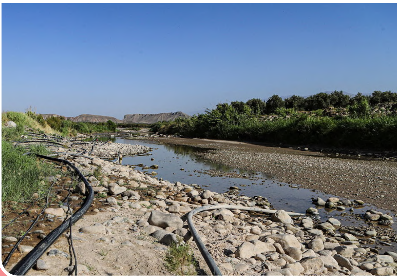
خشکی رودخانه قزل اوزن / بنا به دلایل گوناگونی چندسالی است که در فصل تابستان جریان حرکت رودخانه قزل اوزن از حرکت باز می‌ماند و خشک شدن آب رودخانه قزل اوزن در پایین دست این رودخانه در شهرستان طارم باعث مرگ ماهیان شده است.