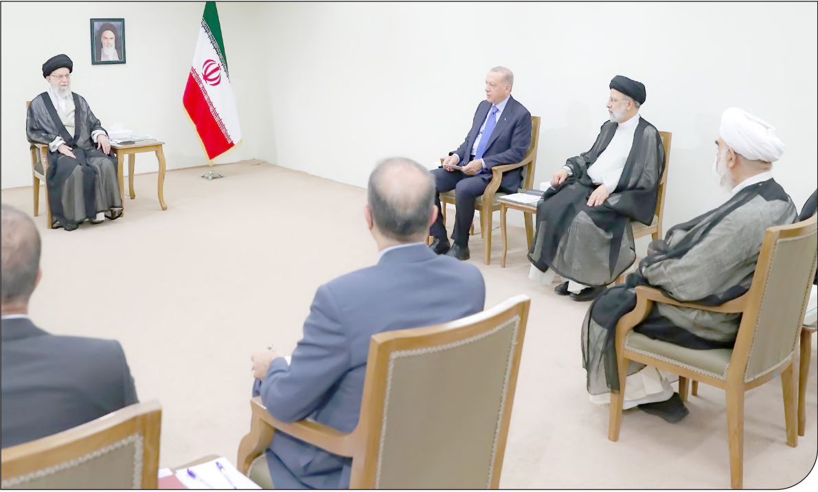
| khamenei.ir |

ستایشی در پاسخ به پرسشی درباره آخرین وضعیت درخواست اعاده دادرسی سیف عراقچی گفت: شعبه اول دیوان‌عالی کشور اعاده دادرسی را مورد پذیرش قرار داد و پرونده به شعبه اول دادگاه انقلاب اسلامی ارجاع شده و تاکنون جلسات متعددی برگزار شده است و به محض اتخاذ تصمیم، اطلاع رسانی می‌شود.