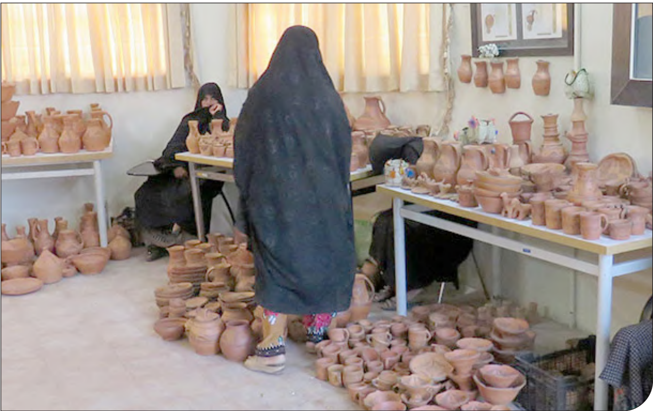
تولید سفال در روستای کلپورگان

بازار قزوین در تیرماه سال ۱۳۹۸ و بهمن ماه سال ۱۳۸۹ نیز دچار حریق شده بود و این هفته هم، یک آتش‌سوزی دیگر را از سر گذارد و آن همه حرف و هشدار هم تا حالا نتیجه‌ای نداشته است.