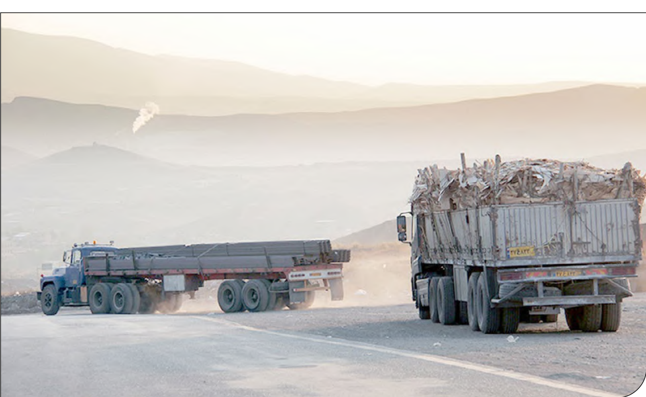
— اقتصاد —

نوسازی کامیون‌ها به نفع کاهش معنادار مصرف سوخت و آلودگی است