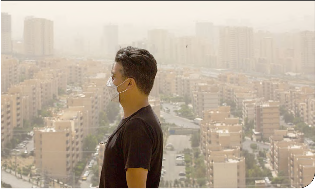
— عظیم —

معاون اول رئیس‌جمهوری با بیان این که به لحاظ کالای اساسی، جزء کشورهای هستیم که کالاهای اساسی بدون هیچ اختلالی تأمین و توزیع شده است؛ گفت: امیداریم برنامه تصویب قیمت‌ها را داشته باشیم. همکاری مردم بسیار خوب بوده است. مردم با فرهنگ بالایی عمل کردند. کشورهای اروپایی رفتند فروشگاه‌ها را غارت کردند. سهمیه‌بندی کردند. اما مردم ما همکاری داشتند و دولت تدبیر دیده بود. کمبود هیچ کالایی را نداشتیم. تغییر قیمت باعث شد کالاها فقط و فقط کمی دیر برسد. امیدار به تثبیت قیمت‌ها هم هستیم. معاون اول رئیس‌جمهوری در پایان درباره آبله میمونی در ایران گفت: تا کنون هیچ نمونه‌ای از آبله میمونی دیده نشده است. برای پیشگیری هم اقداماتی انجام شده است.