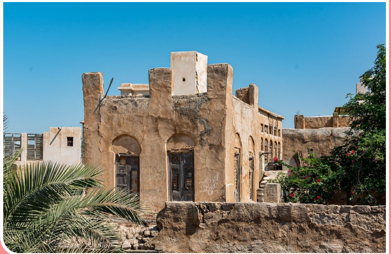
هویت یک مکان جغرافیایی را می‌شود در بافت قدیم آن جستجو کرد. بندر بوشهر با توجه به نزدیکی به دریا و هوای گرم و مرطوب، نوع ساختمان‌سازی دلنشین و زیبایی با مصالحی از سنگ و ساروج و گچ و چوب را انتخاب می‌کرده است.