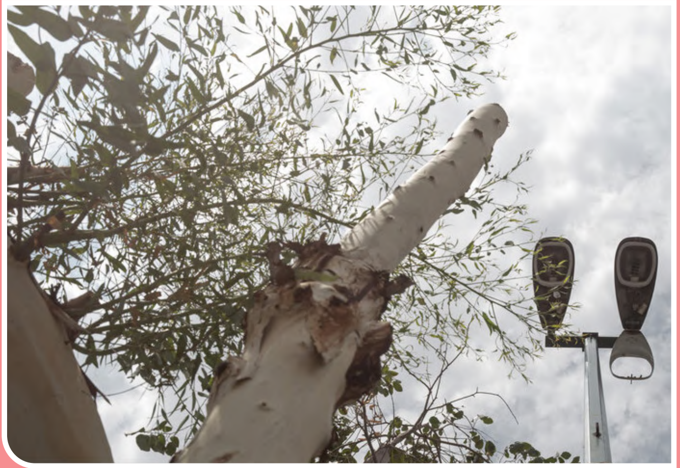
درختان اکالیپتوس به دلیل سریع‌ال رشد بودن و نرمی تنه و شاخه‌ها، در ورزش باد به تاسیسات اطراف خود آسیب می‌رسانند.