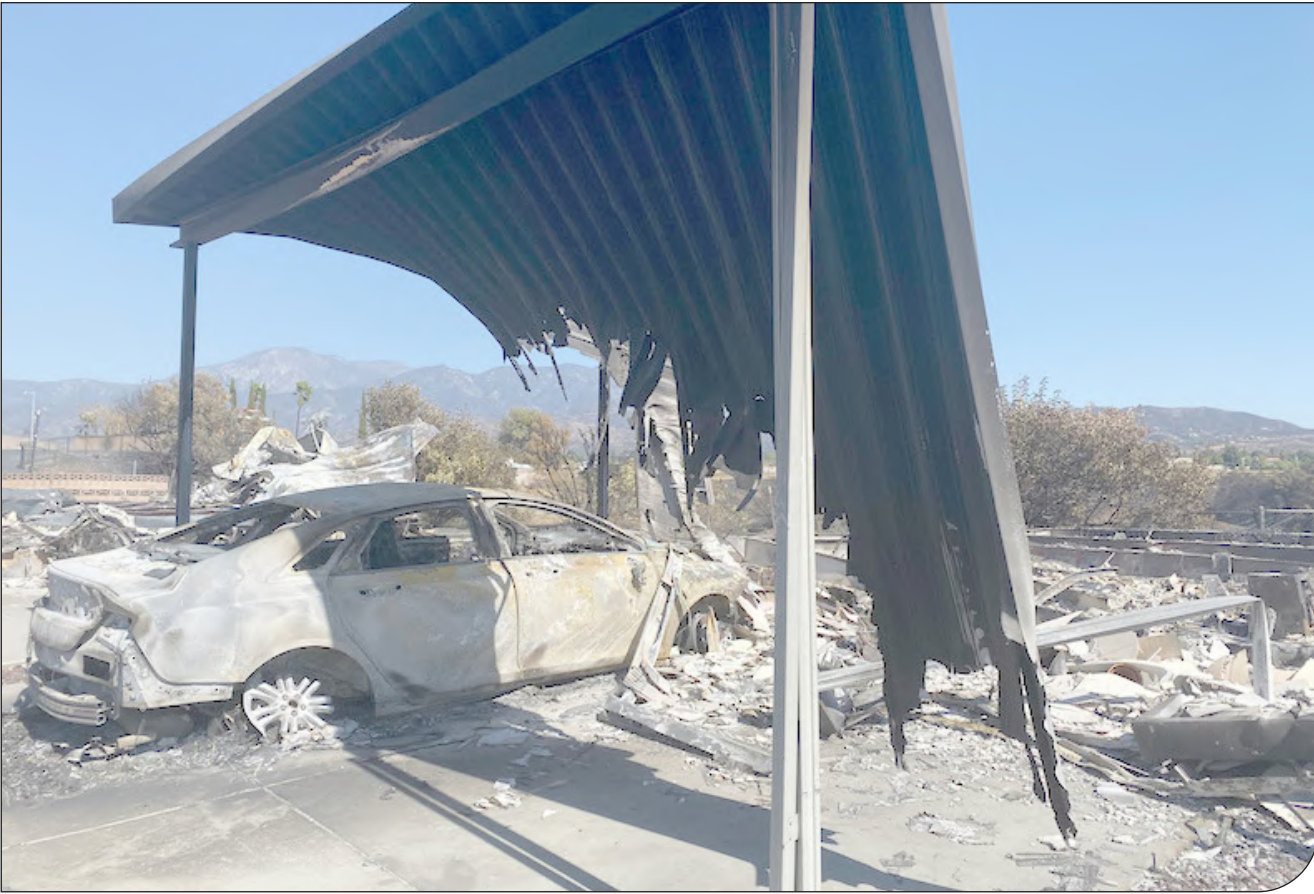
تخریب کامل یک خودرو در اثر زلزله در استان لرستان

زخم‌های جهان گرم‌تر همه‌جای زمین دیده می‌شود؛ از افزایش سطح آب دریاها گرفته تا آب شدن یخچال‌های قطبی و جنگل‌های سوخته. اما تغییر اقلیم نیز آثار شدیدی روی سلامت روان می‌گذارد. آثاری که تاکنون قابل مشاهده نبود. کارشناسان و روان‌شناسان سعی می‌کنند درک کنند که چگونه رنج و آزار دنیای غیرقابل پیش‌بینی و ناپایدار، سلامت ذهن و روان ما را شکل می‌دهد.