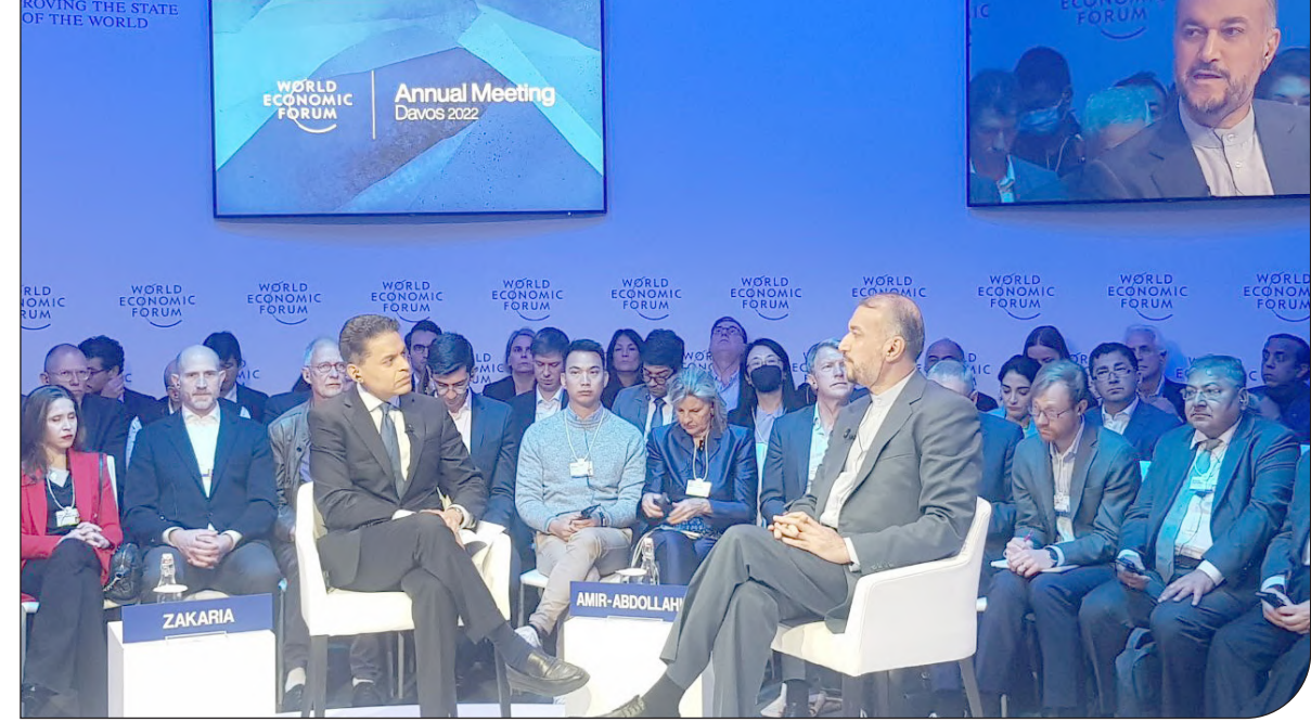
حضور وزیر امور خارجه در نشست گفت‌وگو با نمایندگان کشورهای منطقه‌ای در شهر دوشنبه، از رئیس‌جمهوری و هیئت‌ای تاجیکستانی خود به‌خاطر برگزاری این نشست تشکر و قدرتی‌ا کرد. دربان علی شمخانی در این نشست که با حضور مقامات امنیت ملی کشورهای جمهوری اسلامی ایران، فرارسیون، روسیه، چین، هند، تاجیکستان، قزاقستان، قرقیزبستان، ترکمنستان و ازبکستان در شهر دوشنبه آغاز برگزار شد، با همتایان خود از کشورهای روسیه، هند و تاجیکستان به صورت جداگانه دیدار و گفت‌وگو کرد.

دبیر شورای عالی امنیت ملی کشورمان افزود: مقصر اصلی در وقوع دو فاجعه شامل بروز جنگ بیست ساله در افغانستان و جنگ اوکراین سیاست‌های غلط و توسعه طلبانه امریکا است. او گفت: امریکا نه تنها باید دارایی های مردم افغانستان را آزاد کند، بلکه باید خسارت های مادی که در افغانستان به بار آورده را جبران کند. شمخانی در ادامه افزود: ایران، امنیت درمنطقه را امری به هم پیوسته می‌داند و معتقد است، امنیت، صلح و ثبات در افغانستان برای همه کشورهای منطقه ضروری و لازم است. او تصریح کرد: کشورهای منطقه باید با تمرکز بر عوامل امنیت‌آفرین، اقدامات بازدارنده مشترک برای جلوگیری از شکل‌گیری هسته‌های نامنی می‌ثباتی را در دستور کار قرار دهند. شمخانی، تروبرسیم و افراط‌گرایی را از عوامل مهم ناامنی در افغانستان ذکر کرد و گفت: متأسفانه شواهد و قرائن نگران‌کننده‌ای از حضور و دخالت برخی کشورهای منطقه و فرمانتفه‌ای در انتقال و هدایت تروریست‌ها به افغانستان در دست داریم. او افزود: البته برای مقابله با این مشکل باید کشورها، به ویژه هیات حاکمه افغانستان پاسخگوی مسولیت های خود باشند. شمخانی گفت: احساس تبعیض و محرومیت از حقوق در ابعاد مختلف یکی از اصلی‌ترین زمینه‌هایی است که اجازه سوءاستفاده را به گروه‌های تروریستی می‌دهد و باید بستره‌های چنین بلایی را از بین برد.