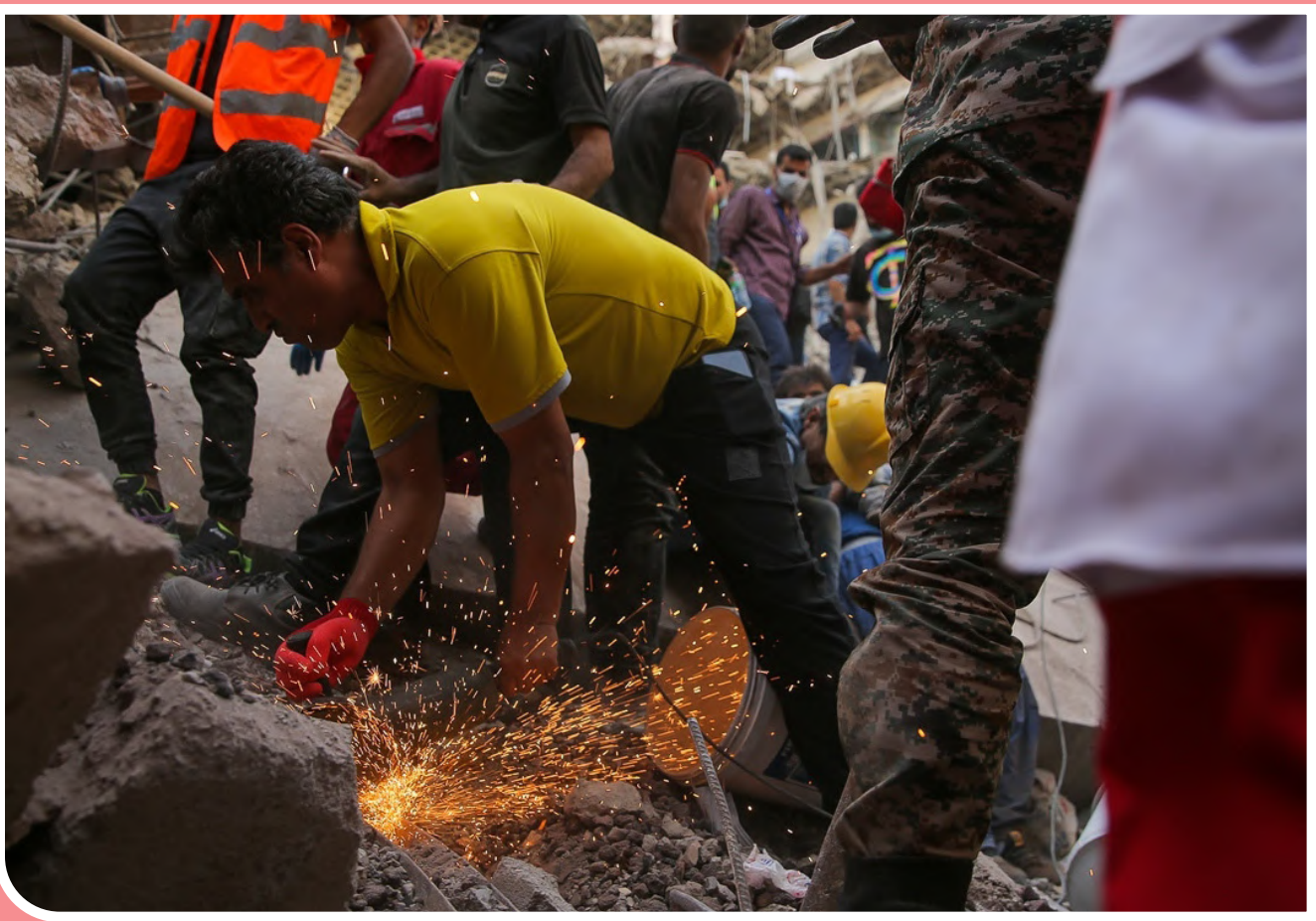
آواربرداری در ساختمان متروپل، روز پنجم، عکس از مرتضی یاقوتی / باشگاه خبرنگاران جوان