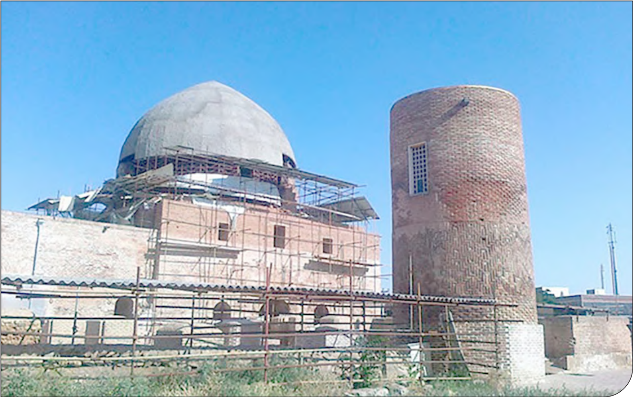
— ۳ — [۱۶]