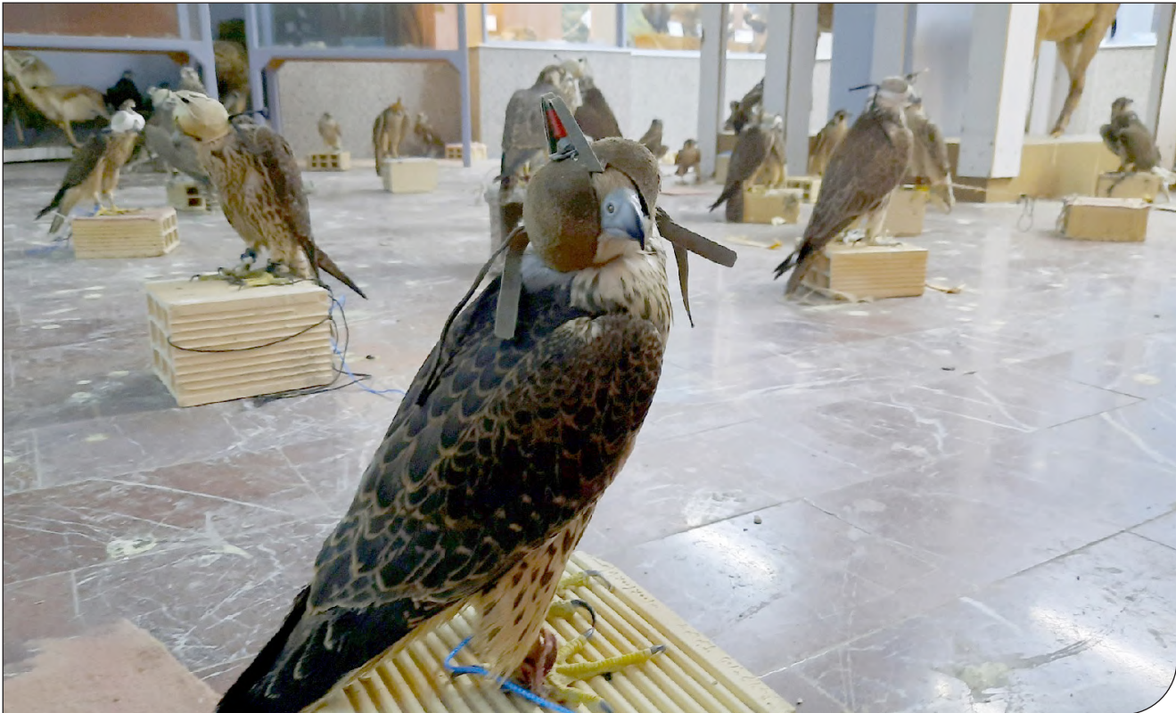
خریداری صید و شکار

بررسی آگهی‌های ۱۲۴ کاربر اینستاگرام و ۱۱۱ پست در تلگرام نشان می‌دهد پرندگان بالاترین تعداد و خزندگان بالاترین تنوع گونه‌ای را در تبلیغات خرید و فروش حیات وحش دارند