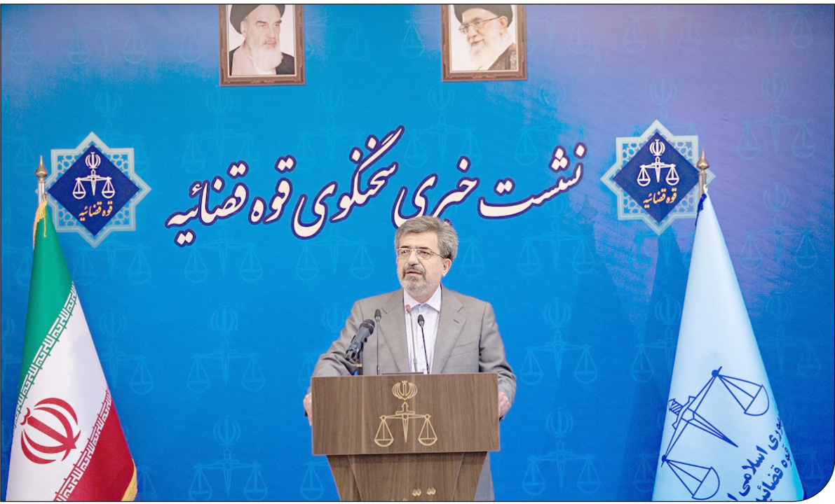
باشگاه خبرنگاران جوان - ۱

سخنگوی جدید قوه قضائیه نسبت به روند دادرسی در ۳ کشور سوئد، آلمان و بلژیک انتقاد کرد