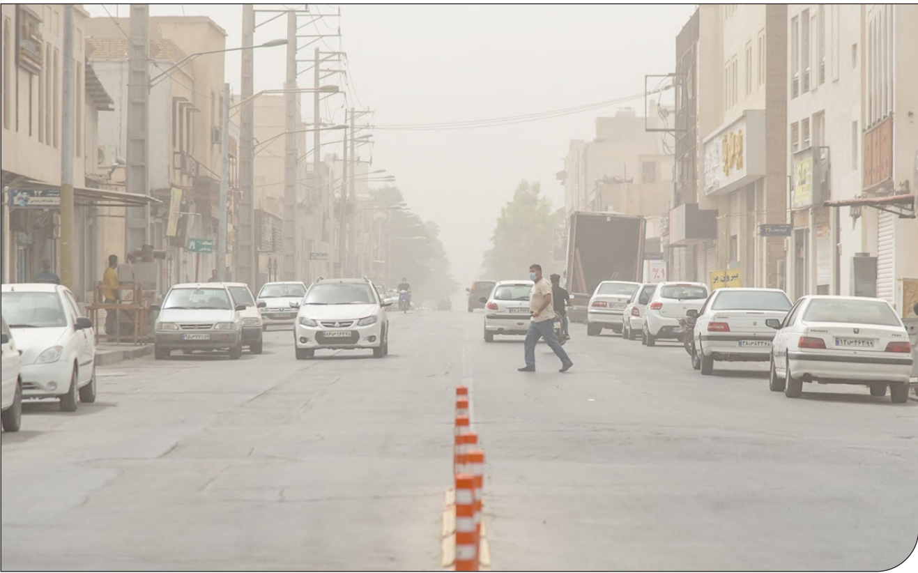
- باشگاه -

مشاور سازمان منابع طبیعی: کانون گردوغبار در بین دجله و فرات، ایران را به شدت تحت تاثیر قرار می‌دهد