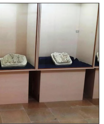
این محوطه را گچبری‌های نفیس منحصر به فرد

با نقوش گل و گیاه و ظروف سفالی منقوش و ساده تشکیل داده است. شهر تاریخی سیمه یکی از آثار تاریخی مهم کشور بوده که قرار است در آثار جهانی ثبت شود و البته اشیا تاریخی این شهر حکایت از تمدنی مهم در این منطقه دارد. در سال‌های گذشته آثار متنوع تاریخی از شهرستان دره‌شهر به خصوص شهر تاریخی سیمه به دست آمده که امروز موزه