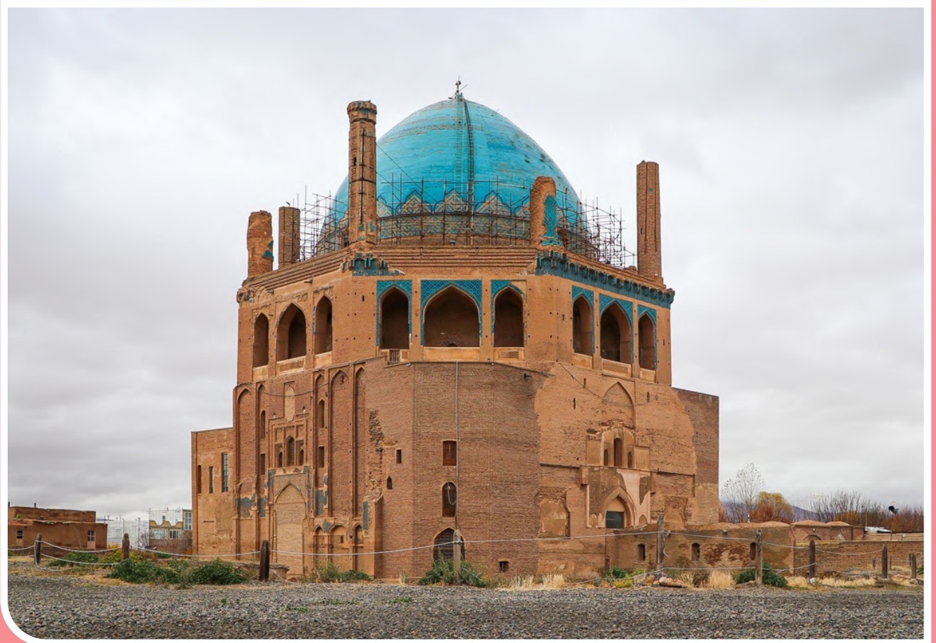
«گنبد سلطانی» شاهکار رو به زوال، عکس از محمد رضاحانی / باشگاه خبرنگاران جوان