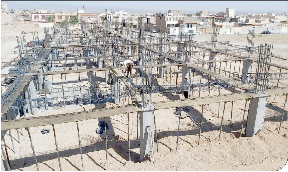
رئیس‌جمهوری با انتقاد نسبت به روند اجرای «نهضت ملی مسکن» گفت که این مباحث مربوط به ۳، ۴ ماه نخست است

رئیس دستگاه قضا با تأکید بر اینکه مقابله همه‌جانبه با پدیده قاچاق به صرف راه‌اندازی و اتصال سامانه‌های یکپارچه تحقق نمی‌یابد، بیان داشت: به منظور مقابله جدی با پدیده شوم قاچاق که یکی از موانع اصلی رونق و جهش تولید در کشور است، ضروری است دستگاه‌های مسئول تشریک مساعی و تعامل بیشتری داشته باشند و من در اینجا رئیس سازمان بازرسی و رئیس کل دادگستری استان تهران را مکلف می‌کنم با برگزاری نشست‌های تخصصی مشترک با اعضای کمیسیون اصل ۹۰ مجلس، موضوعات و مسائل این حوزه از جمله راه‌اندازی و اتصال سامانه‌های لازم و تخلفات صورت گرفته در این زمینه را احصاء و جمع‌بندی کنند و بدین‌ترتیب یک کار عملی منسجم در حوزه مقابله با قاچاق صورت گیرد. او گفت: البته تعدادی از متخلفان در حوزه سامانه‌های مبارزه با قاچاق از ناحیه سازمان بازرسی به دادرسا معرفی شده‌اند اما باید توجه داشت که صرف این اقدام کفایت نمی‌کند و باید این مسئله را به صورت ریشه‌ای و اساسی با همکاری و تعامل مرتفع کنیم.