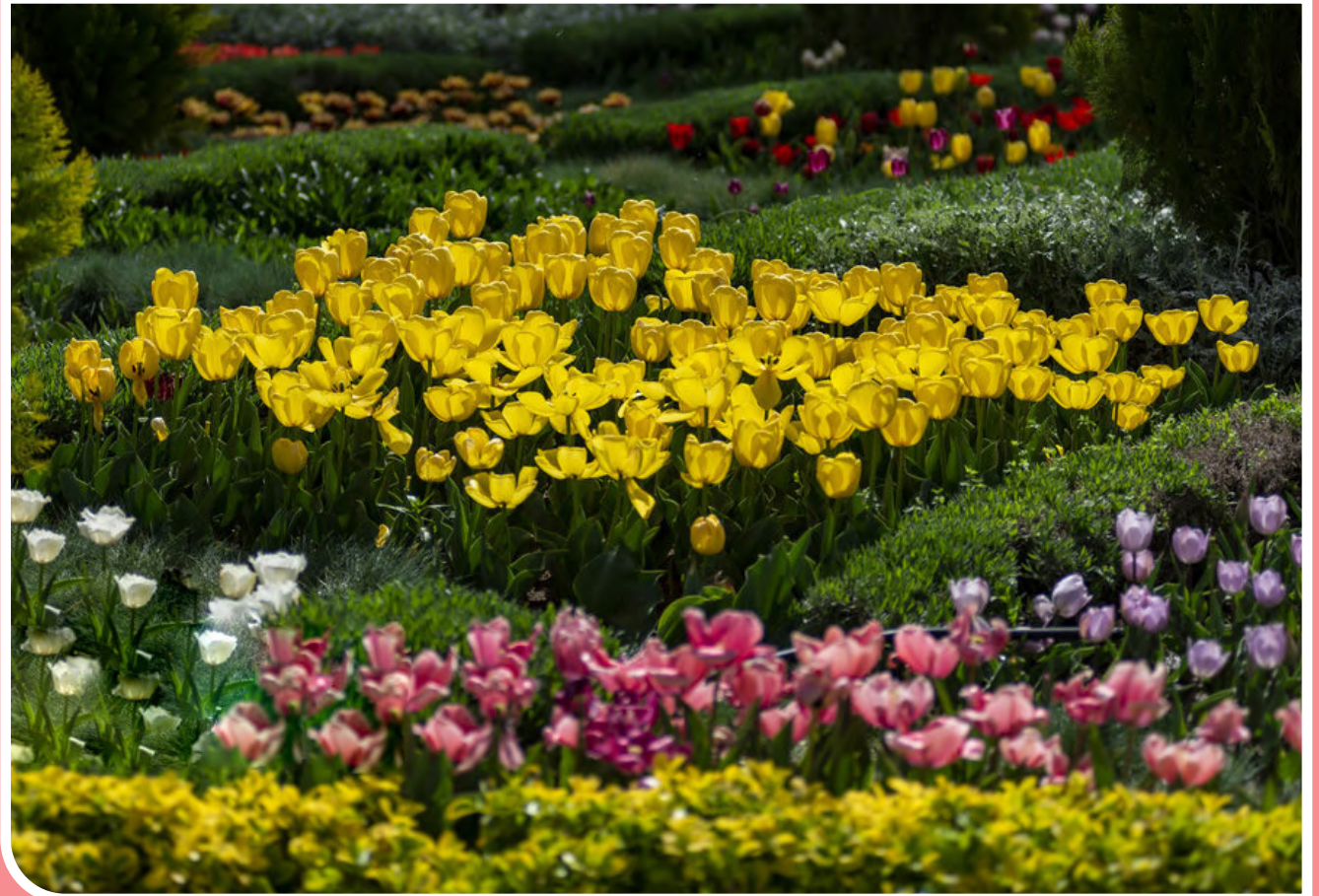
هشتمین جشنواره لاله‌های کرج