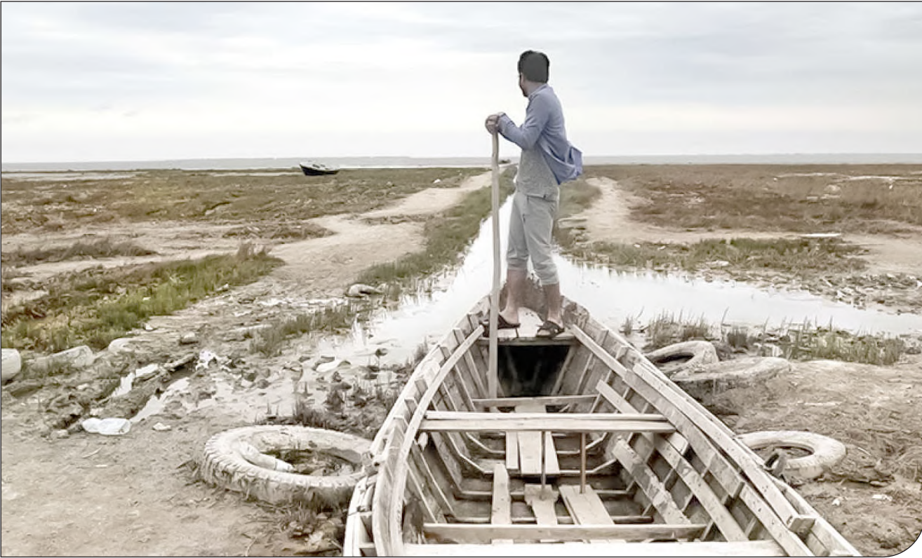
- 3 -

قانون اجازه تشکیل مرکز مطالعات و تحقیقات دریای خزر با مشارکت دولت‌های فدراسیون روسیه و ایران بیش از ۳ دهه است فراموش شده است