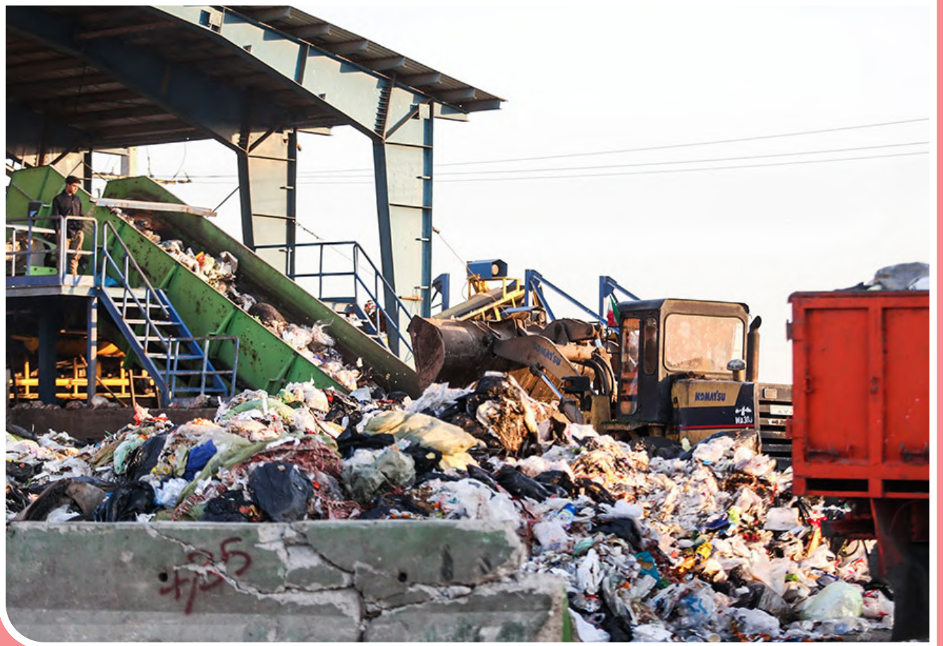
بازیافت در خدمت زمین پاک