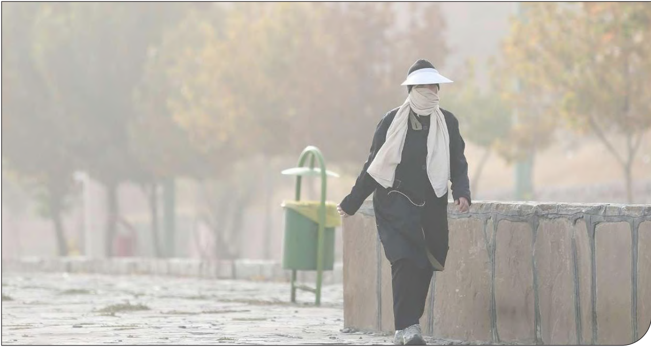
— ۳۳ —

علی سلاجقه:۵۱ مخاطره طبیعی در ایران وجود دارد که ۱۱ مخاطره در دستور اصلی کارها قرار گرفت که یکی از آنها پدیده گردوغبار است از ۵ استان کشور بیش از ۵۰۰ هزار نفر به استان‌های شمالی کشور مهاجرت کردند که علت آن کم‌آبی و نامساعد بودن شرایط محیط زیستی است