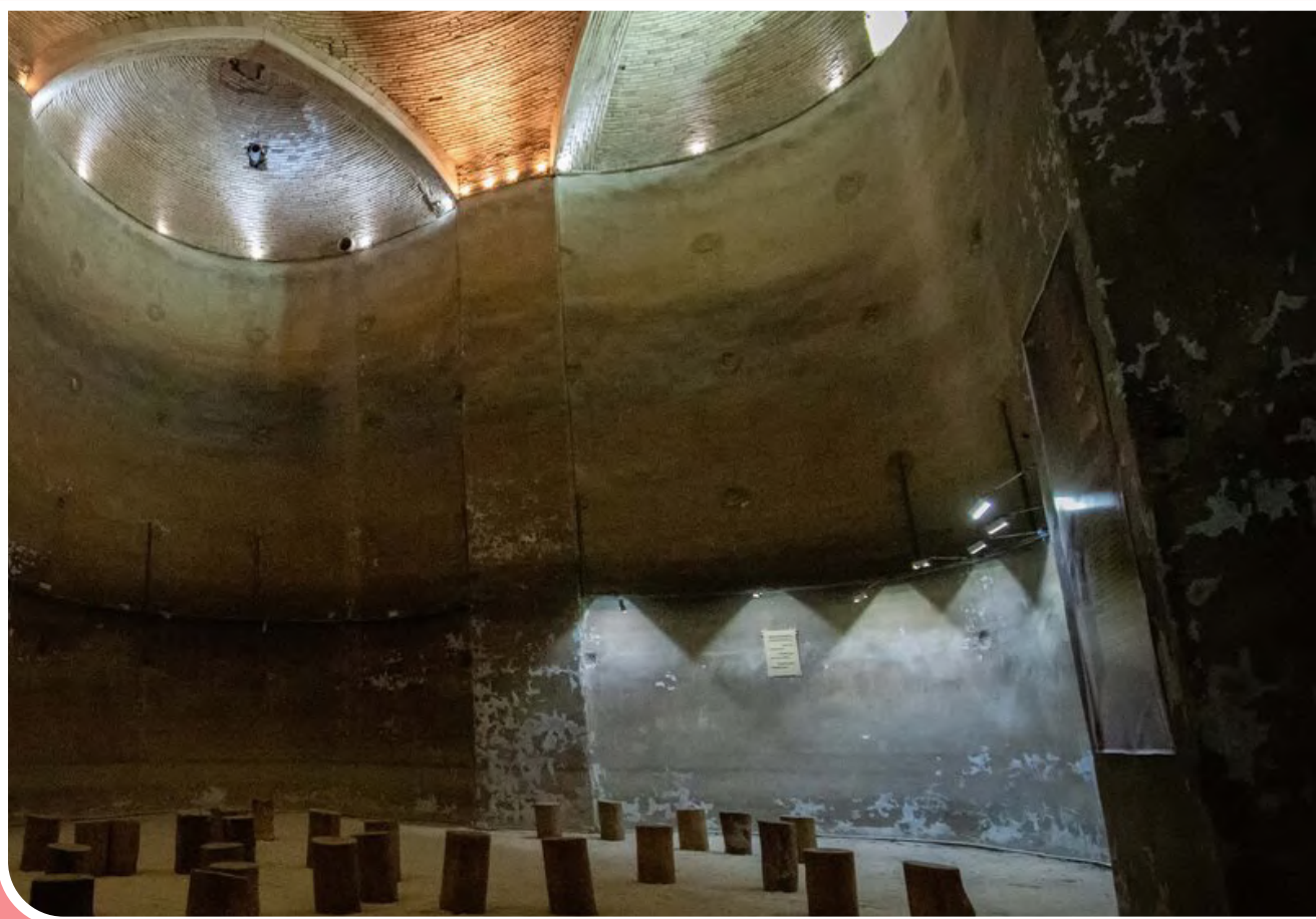
بزرگترین شهر زیرزمینی تاریخی دنیا