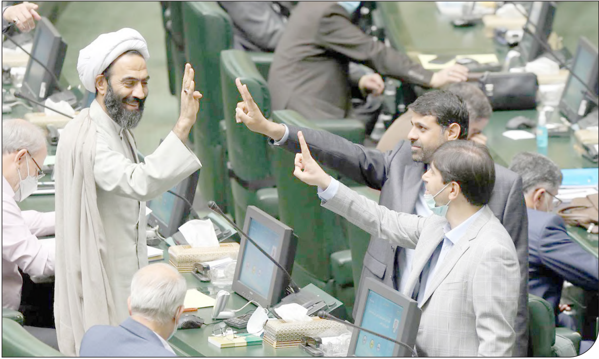
— مجلس شورای اسلامی —

بر اساس گزارش مرکز اطلاع رسانی وزارت کشور، آیت‌الله ریسی رئیس جمهوری اسلامی ایران روز ۲۱ فروردین دستور داد که موضوع احداث پتروشیمی میانکاله بررسی و با احصای موارد خلاف قانون و آسیب‌زا برای محیط زیست، سریعاً از اجرای آن جلوگیری شود.