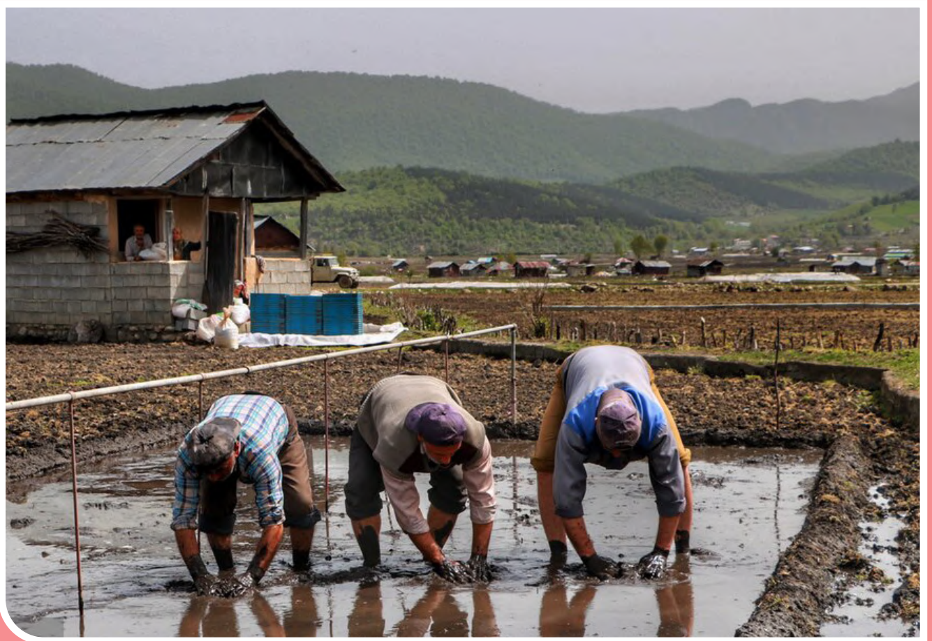
خزانگیبری برنج در مازندران